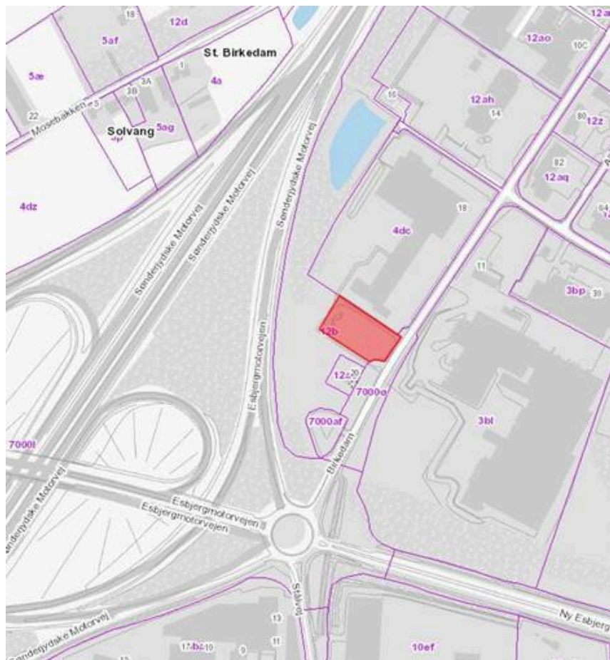
Lastbilkøring på Birkedam - vist med rød skravering.

Kolding Kommune har i alt 3 offentlige langtidsparkeringspladser i Kolding, som lastbiler kan henvises til. Kommunen er ikke forpligtet til at yde denne service, men idet der i Kolding Kommunes parkeringsbekendtgørelse er fastsat bestemmelser om, at motorkøretøjer med en tilladt totalvægt over 3500 kg og påhængs- og sættevogne med tilladt totalvægt over 750 kg indenfor byzone ikke må parkeres i mere end 6 timer på veje, gader og pladser, har Kolding Kommune valgt at yde denne service med langtidsparkeringspladserne.