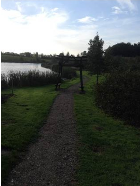
Stien set fra Vestergade.