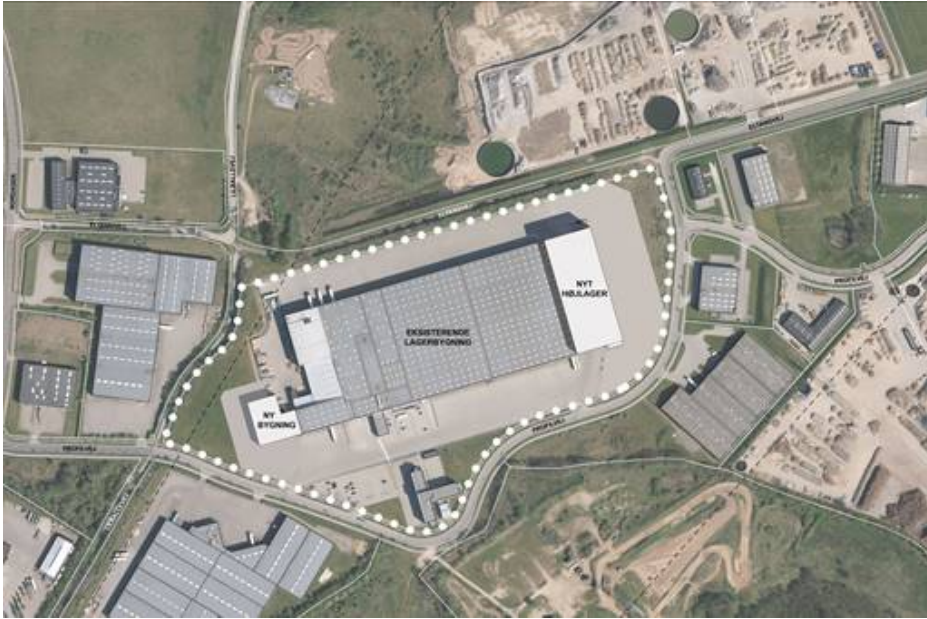
Illustrationsplan der viser hvordan området kan komme til at tage sig ud.

Bebyggelsen skal opføres i grå, sorte og hvide nuancer, så der skabes en sammenhæng med de omkringliggende bygninger og de eksisterende bygninger inden for området. Der fastlægges særlige bestemmelser for det planlagte højlager, som skal sikre en farvemæssig variation i facaden under hensyntagen til den tekniske facadeløsning. Arkitekturstrategien vil blive anvendt som dialogværktøj i forhold til farveholdningen af facaden samt udformning og omfang af skiltning.