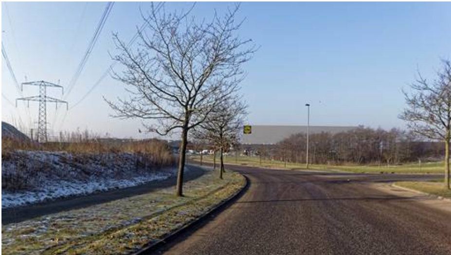
Visualisering af hvordan det planlagte højlager kan komme til at se ud set fra den østlige ende af Profilvervej.

Bebyggelsen skal opføres i grå, sorte og hvide nuancer, så der skabes en sammenhæng med de omkringliggende bygninger og de eksisterende bygninger inden for området. Der fastlægges særlige bestemmelser for det planlagte højlager, som skal sikre en farvemæssig variation i facaden under hensyntagen til den tekniske facadeløsning. Arkitekturstrategien vil blive anvendt som dialogværktøj i forhold til farveholdningen af facaden samt udformning og omfang af skiltning.