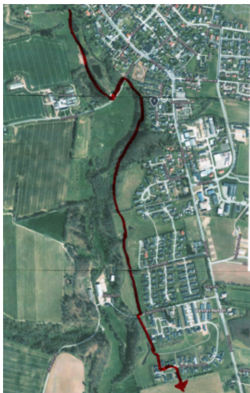
Ønske til nyt stiforløb.