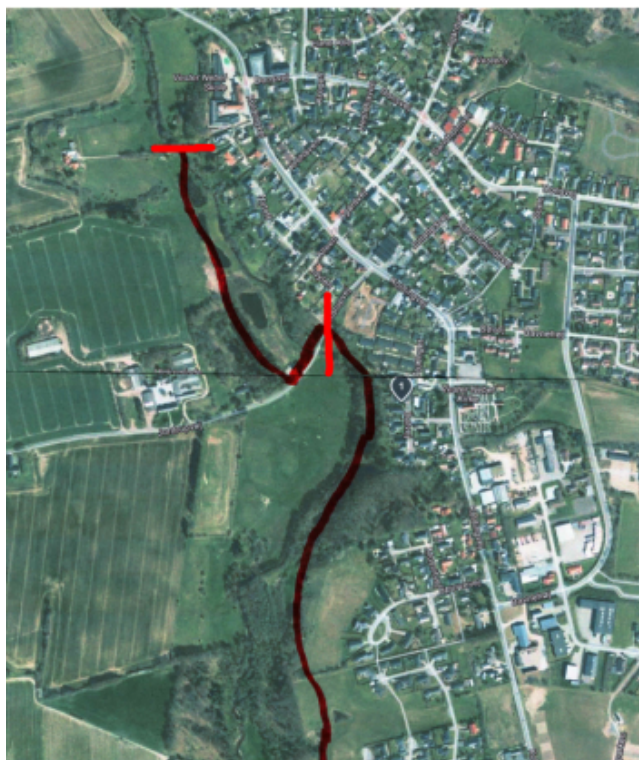
Første etape af det ønskede stiforløb.

Vester Nebel ønsker at reetablere stien fra Jordrupvej og op gennem skråningen til skoven, så vil forbindelsessti blive markant forbedret. Der vil således blive mulighed for at gå via etablerede stier fra skolen og til Elkærholmparken i syd. Stien vil blive en stor gevinst for fremkommeligheden for naturelskere og ikke mindst de lokale borgere.