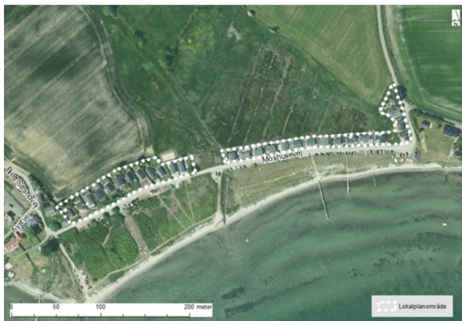
Luftfoto med lokalplanområdets afgrænsning