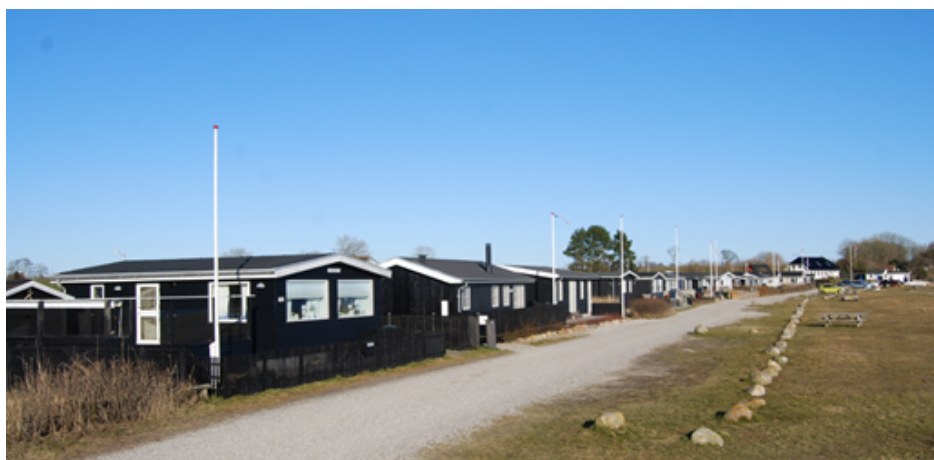
Foto af bebyggelsen i den østligste og lavest beliggende del af planområdet

At fastholde en kulturmiljøudpegning, med deraf følgende begrænsninger på mulighed for ændring af byggeri, er herudover svært foreneligt med ønsket om at klimasikre byggeriet i området ved at skabe mulighed for højere bygninger.