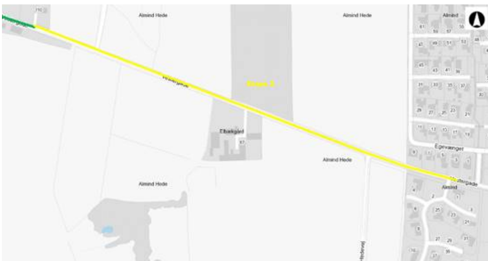
Etape 2 – Gul markering. Fra Vestergade ved Stagebjerg Alle til Vestergade 110 – ca. 800 m. Sidste stykke ind til Almind by. Færdiggøres efterår 2018.