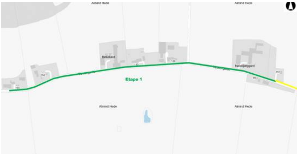
Etape 1 – Grøn markering. Fra Vestergade 110 til Vestergade 166 – Ca. 800 m. Forlængelse af nuværende udvidelse. Udført i 2017.