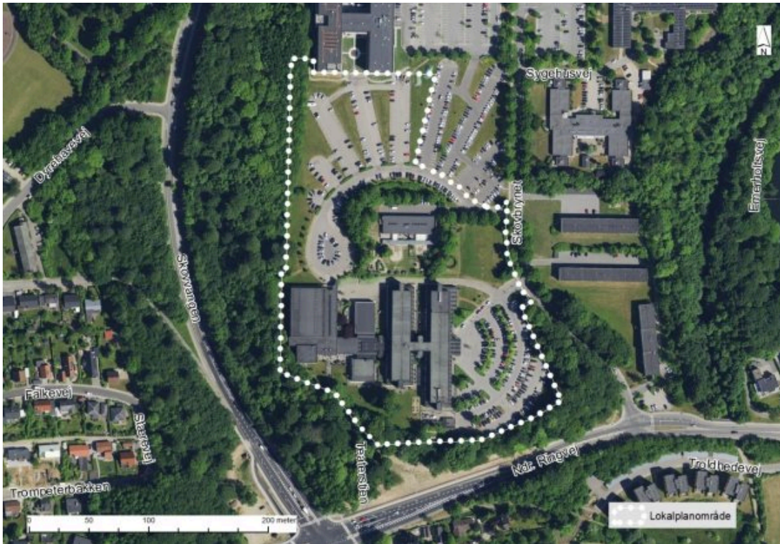
Luftfoto med lokalplanområdets afgrænsning.