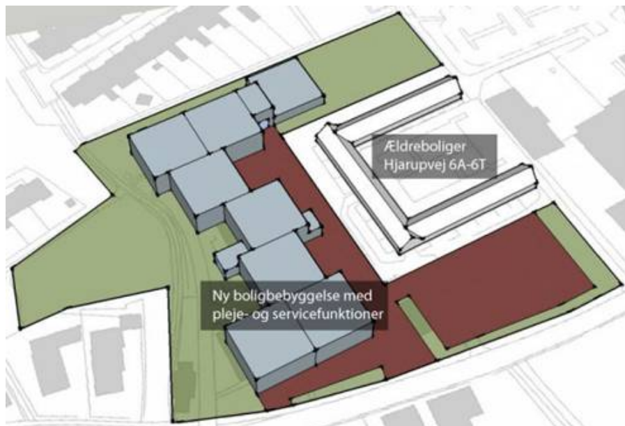
Illustration 1 viser princip 1 for placering af bebyggelsen.