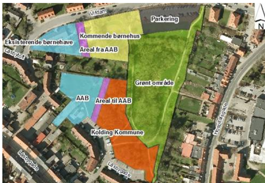
Kort 2: Forslag til fremtidig arealdisponering i Vifdam-området.

I den sydlige del af Vifdam-området, uden for reserveringen til grønt område, er der udpeget ca. 3.800 m 2 til boliger på Kolding Kommunes arealer.