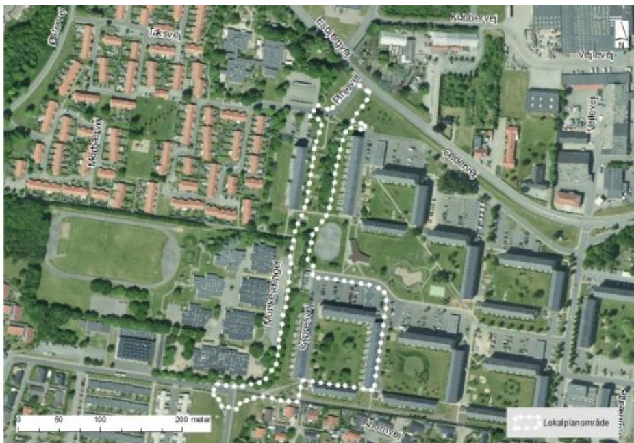
Lokalplanområdets afgrænsning vist på luftfoto