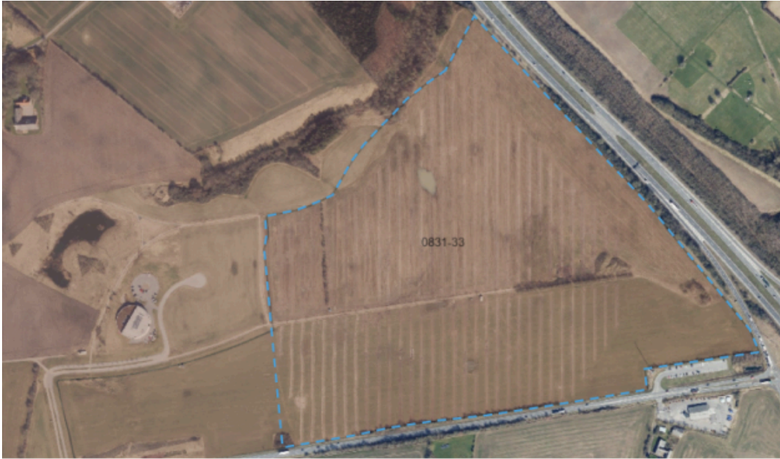
Afgrænsningen af spildevandstillægget – blå streg

Forslaget til spildevandsplantillægget vil blive fremlagt i 8 ugers offentlig høring fra uge 46/2021.