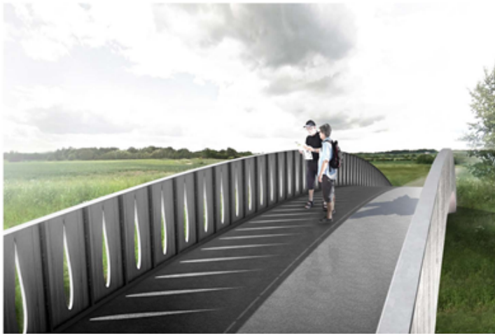
Collage - inderside