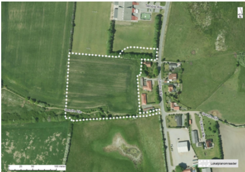
Nyt boligområde ved Stepping

Forslag til Spildevandsplantillæg 06 – Nyt boligområde ved Stepping - til Kolding Kommunens Spildevandsplan 2018-2025 (Blå Plan) er udarbejdet for at præcisere, hvordan spildevand og regnvand skal håndteres i det nye boligområde.