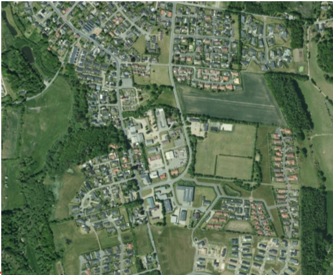
Figur 1. Stiforløb

Af § 96 i Lov om offentlige veje fremgår det bl.a., at vejmyndigheden kan ekspropriere til offentlig vej eller sti, når det er nødvendigt af hensyn til almenvellet. I § 97 præciseres det, at der kan eksproprieres til nyanlæg, udvidelse og ændring af bestående anlæg.