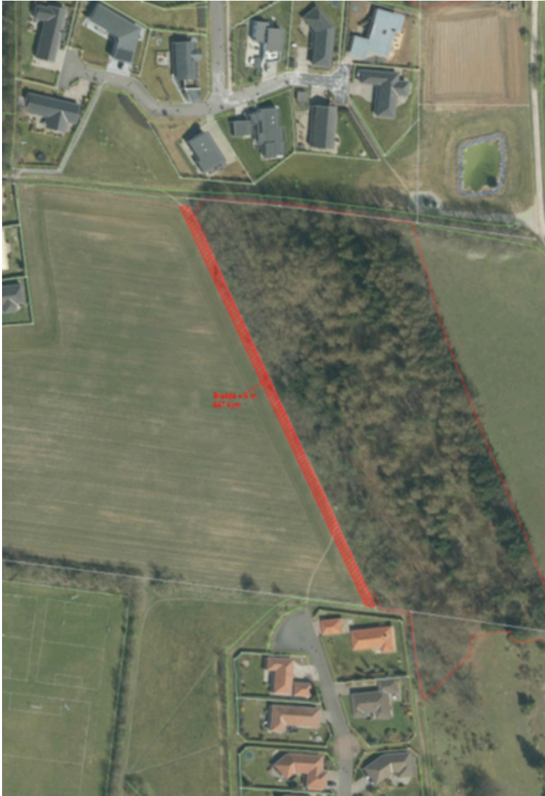
Figur 2. Arealet markeret med rødt skal eksproprieres.