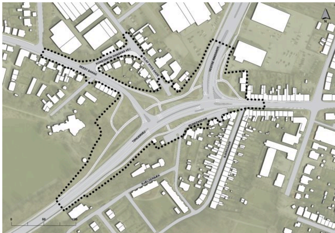
Illustrationsplan – forventet udformning af krydsene efter omlægning