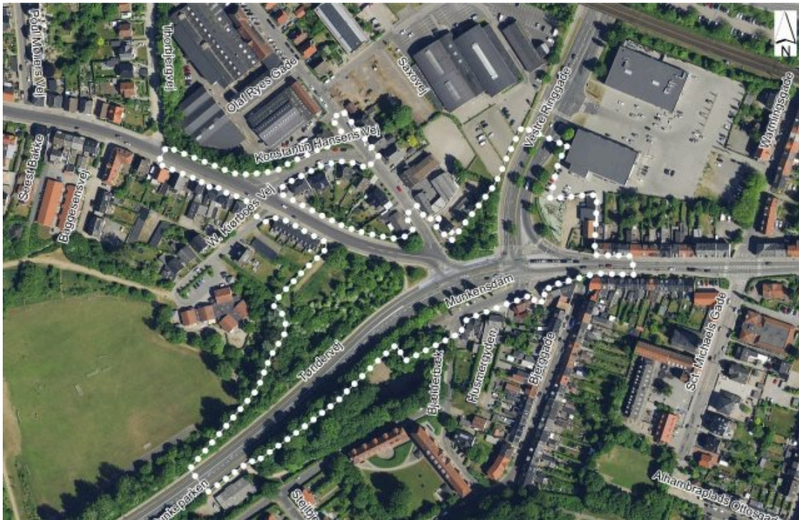
Luftfoto af området med afgrænsning af planområdet