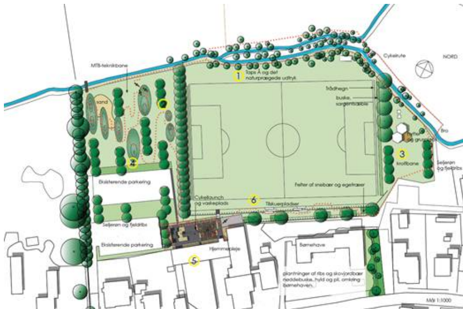
Helhedsplan for det rekreative område i Taps.