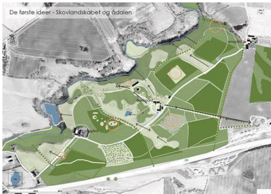
Forslag til en samlet friarealplan omkring Landbomuseet.

Beløbet til rådgivning blev delt i to og der søges i år til færdiggørelse af restbeløbet. Landbomuseet er indrettet på den statsejede ejendom, Brødsgård, som ligger midt i det statsejede skovområde, Harte Skov.