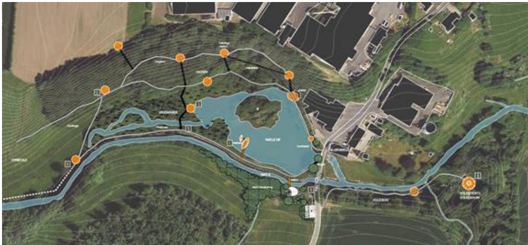
Oversigtsplan over området ved Aller Mølle.

Der blev i 2017 afsat midler til udarbejdelse af en helhedsplan for de rekreative muligheder omkring Aller Mølledam. Der er nedsat en lokal arbejdsgruppe med en bred repræsentation fra de frivillige i området og fra fonden, Aller Mølle. I arbejdet med helhedsplanen er der dukket yderligere rekreative potentialer frem, muligheder som vil gøre området omkring Aller Mølledam endnu mere attraktivt i rekreativ og i læringsmæssig henseende. Der er også skitseret på at forskønne området omkring bålhytten med forbedrede adgangsforhold og strukturerende beplantninger og forslag til placering af en p-plads.