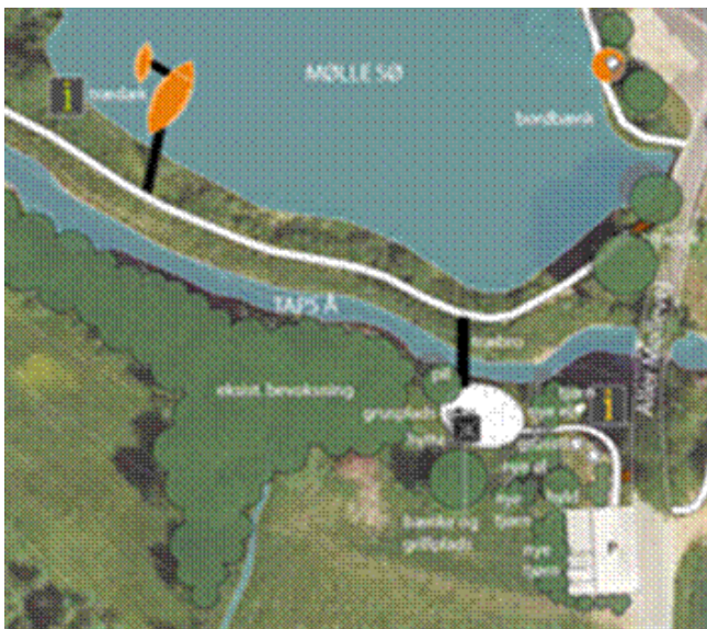
Udsnit af helhedsplan med hytte, træbro og flydebro.

Kontaktforum har imødekommet 75.000 kr. til broen over Aller Mølleå.