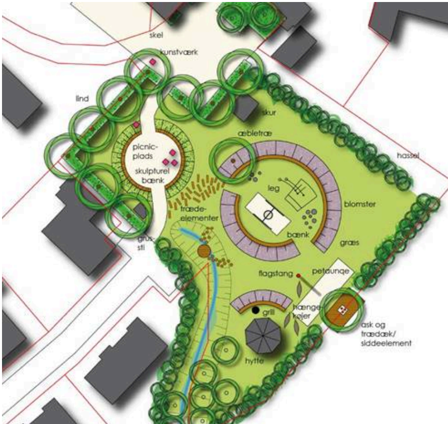
Foreløbig skitse af Folkeparken i Sdr. Stenderup.

Kontaktforum har imødekommet med 25.000 kr. til færdiggørelse af skitseprojektet og 40.000 kr. til etablering af en træbænk omkring et markant træ, hvorfra der er udsigt til landskabet og Solkær Enge.