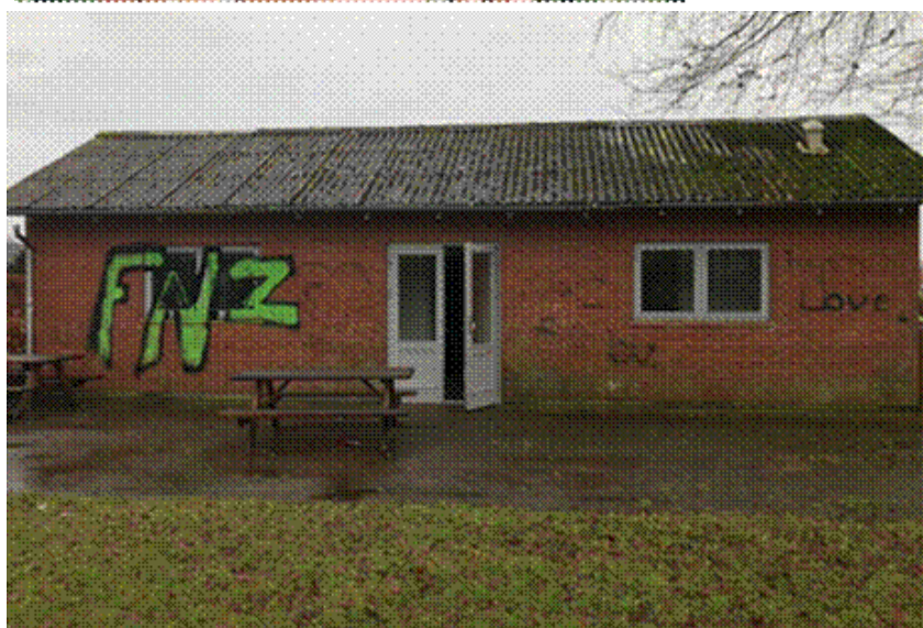
Aktivitetsparken en kærlig hånd.