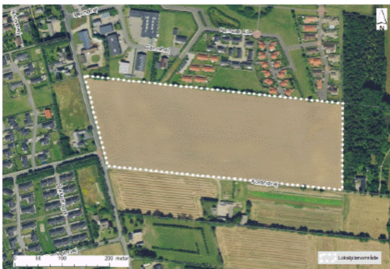
Kort over lokalplanområdet

Projektet finansieres af de afsatte midler i byggemodningsrammen.