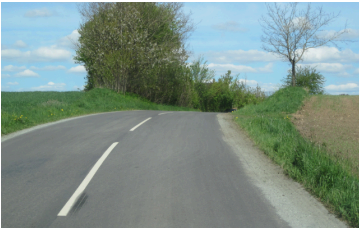
Dårlig mødesigt grundet kurve og bakke

Der er flere steder, hvor der pga. kurver ikke er tilstrækkelig mødesigt (heller ikke, hvis der skiltes ned til 60 km/t). Se eksempler nedenfor.