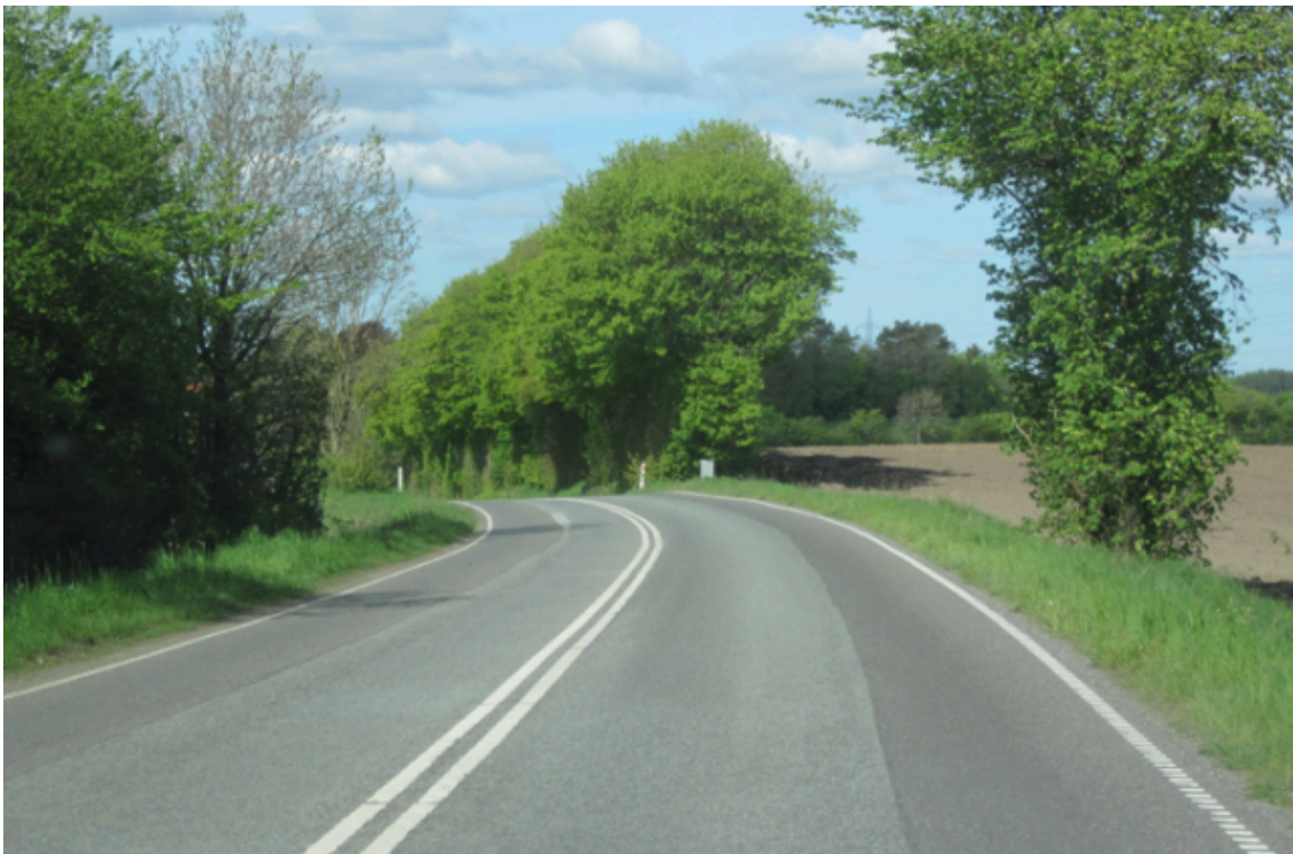
Dårlig mødesigt grundet kurve

Konklusionen er derfor, at strækningen på Esbjergvej ikke egner sig til at blive omdannet til ”2 minus 1-vej”, da kørebanelen på store dele er for bred, trafikmængden på delstrækninger er i den høje ende samt, at det ikke er muligt at opnå tilstrækkelig mødesigt. Forvaltningen kan dermed ikke anbefale, at strækningen omdannes til ”2 minus 1-vej”.