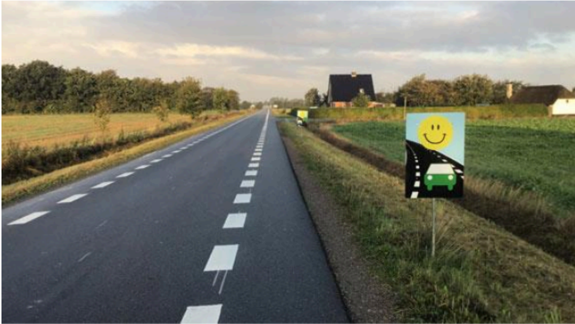
Eksempel på ”2 minus 1-vej”