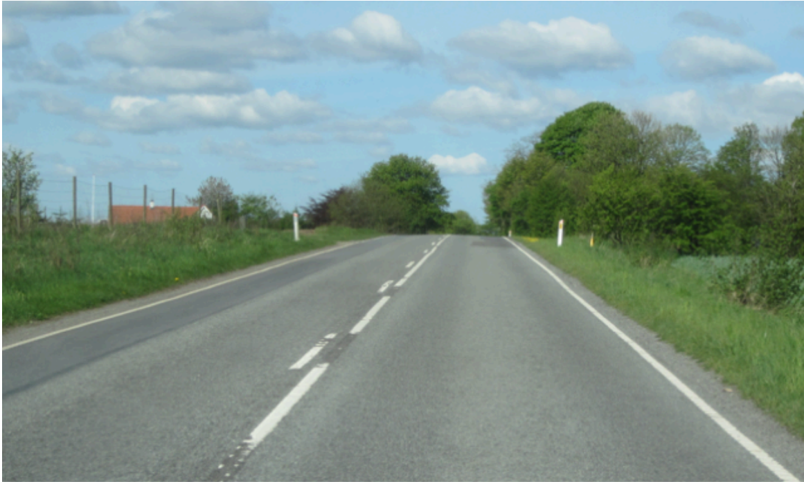
Dårlig mødesigt grundet bakke