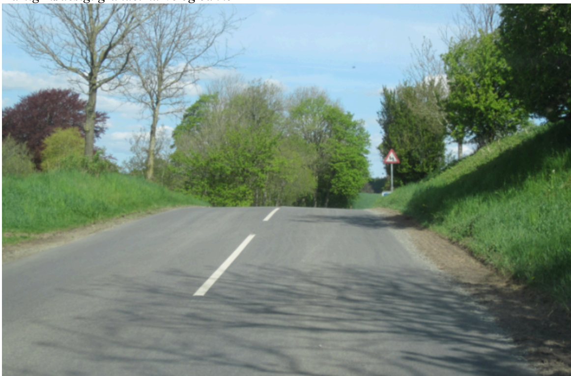
Dårlig mødesigt grundet bakke

Konklusionen er derfor, at strækningen ikke egner sig til at blive omdannet til ”2 minus 1-vej”, da kørebanen visse steder er for smal samt, at det flere steder ikke er muligt at opnå tilstrækkelig mødesigt. Forvaltningen kan dermed ikke anbefale, at strækningen omdannes til ”2 minus 1-vej”.