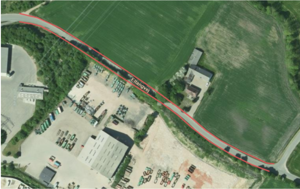
Eltangvej – forslag til sideudvidelse i begge sider af vejen.

Sideudvidelsen af Eltangvej afhjælper udfordringerne, når to køretøjer passerer hinanden, men forbedrer ikke forholdene for de lette trafikanter væsentligt.