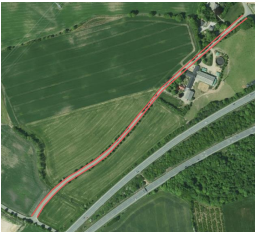
Nr. Stenderupvej – forslag til cykelbaner i begge sider af vejen.

Der er beregnet en overslagspris på ca. 3.663.000 for anlæg af cykelbaner samt en overslagspris på ca. 40.000 kr. for afledt drift.