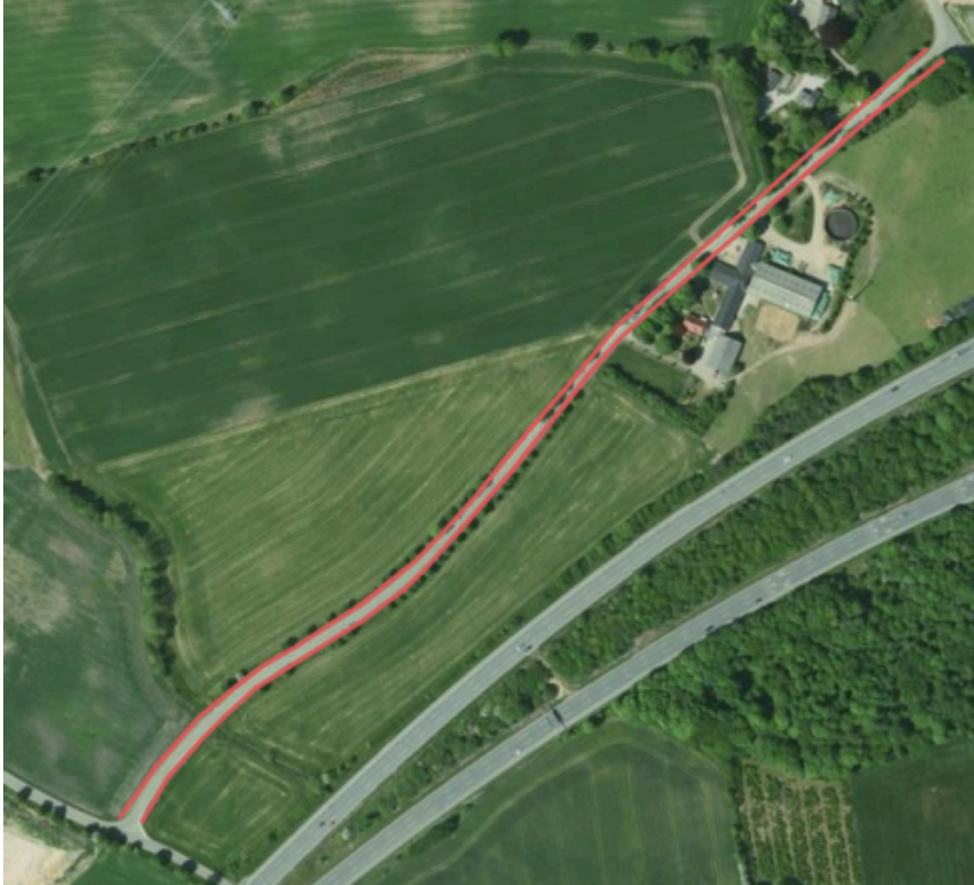
Nr. Stenderupvej – forslag til sideudvidelse i begge sider af vejen.

Forvaltningen foreslår, at Nr. Stenderupvej sideudvides til 7 meters bredde på en strækning af ca. 700 meter. Der er beregnet en overslagspris på ca. 4.317.000 kr. for anlæg af sideudvidelsen samt en overslagspris på ca. 40.000 kr. for afledt drift.