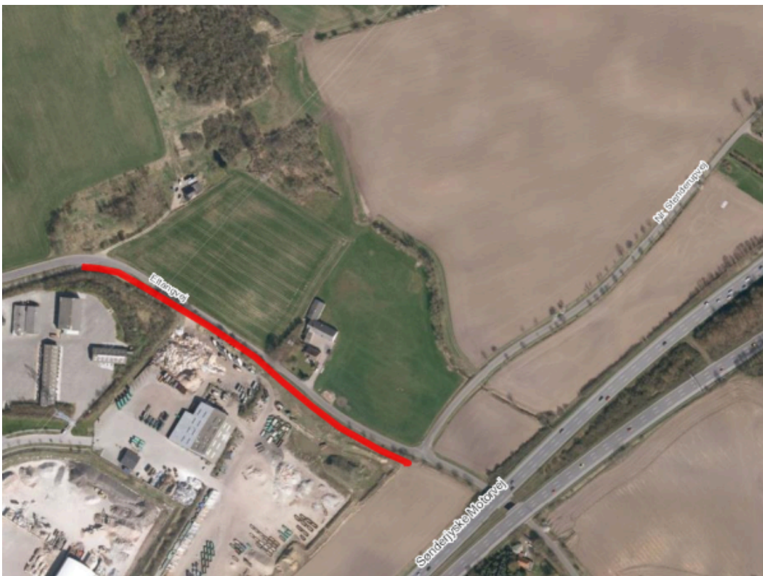
Eltangvej – forslag til dobbeltrettet cykelsti i den sydvestlige side af vejen.

Anlæggelse af en dobbeltrettet cykelsti på Eltangvej kan udelukkende ske, hvis Eltangvej sideudvides. Anlæggelse af cykelsti uden en sideudvidelse vil betyde, at det bliver meget vanskeligt at sideudvide Eltangvej på et senere tidspunkt.