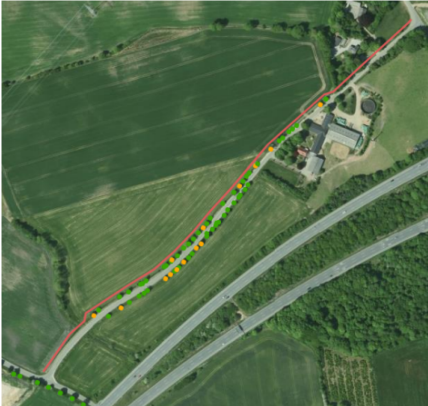
Nr. Stenderupvej – forslag til dobbeltrettet cykelsti i den nordvestlige side af vejen.

Anlæggelse af en dobbeltrettet cykelsti på Nr. Stenderupvej kan udelukkende ske, hvis Nr. Stenderupvej sideudvides. Anlæggelse af cykelsti uden en sideudvidelse vil betyde, at det bliver meget vanskeligt at sideudvide Nr. Stenderupvej på et senere tidspunkt.