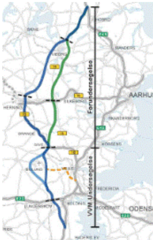
Vejdirektoratets oversigtskort (fra regeringsaftalen) med angivelse af principkorridorer for den Midtjyske motorvej.

Vejdirektoratet vil frem til sommeren 2019 arbejde videre med fastlæggelse af konkrete forslag til linjeføring og vurdering af disse.