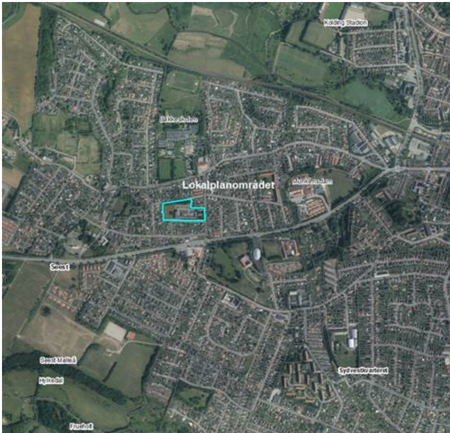
Oversigtskort med lokalplanområdets placering