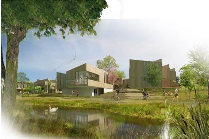
Prospekt fra Lejerbo Koldings boligprojekt

I offentlighedsfasen inviteres til borgermøde med henblik på information og dialog om lokalplanens indhold og betydning for den videre byudvikling i området. Ved mødet ønsker Lejerbo Kolding også at præsentere det bearbejdede projekt for Fremtidens Bæredygtige Almene Bolig, der opføres som 1. etape af områdets bebyggelse.