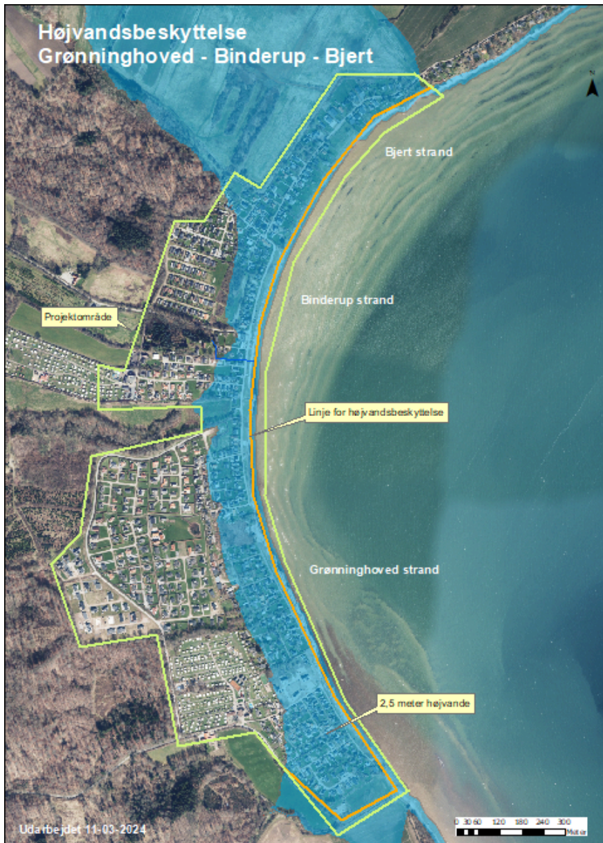
Projektområde og strækning med højvandsbeskyttelse

I det område, der bliver berørt af kystsikringsprojektet, er der få kommunalt ejede arealer. De er alle grønne områder eller vejareal, som er privat fællesvej. Der er ligeledes begrænsede strækninger af kommunevej, som vil blive berørt af projektet.