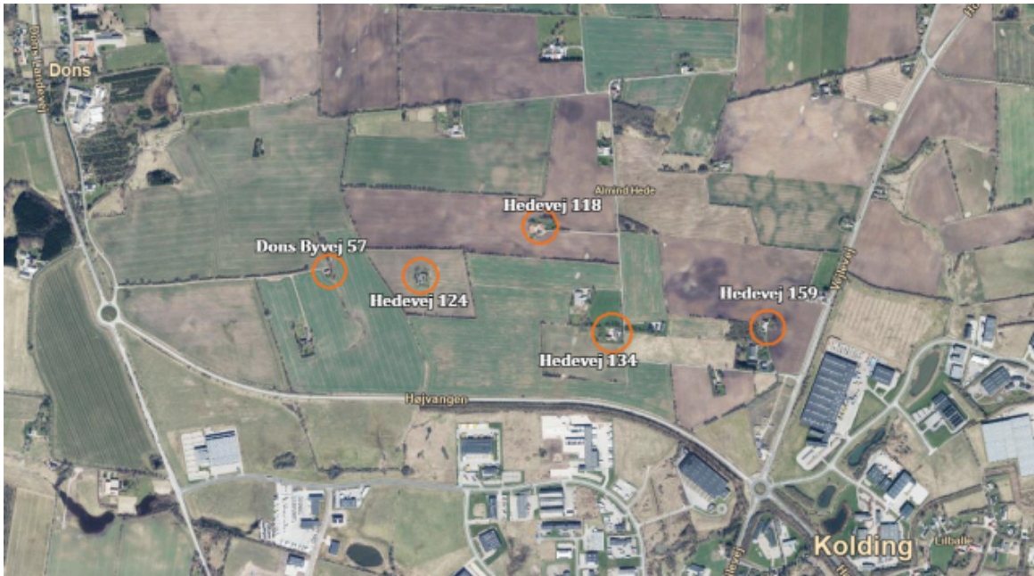
Ejendommenes beliggenhed i det kommende erhvervsområde nord for Højvangen