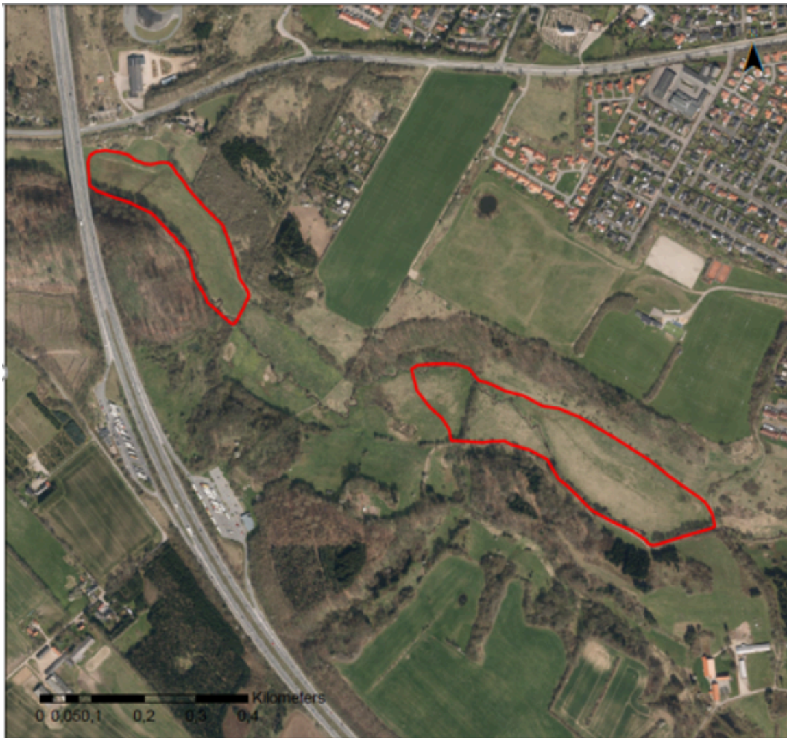
Kortudsnit med de to projektområder

naturen og de rekreative muligheder. Det primære projektelement i begge områder – i forhold til at tilbageholde vandet – er et dige med en rørbro til neddrøsling af vandføringen ved kraftig regn i kombination med en omlægning af Seest Mølleå. Under normale afstrømningsforhold forekommer der ingen opmagasinerings af vand, men ved store regnhændelser staves vandet op først i det østligste område og sidenhen i det vestlige (se nedenstående kort).