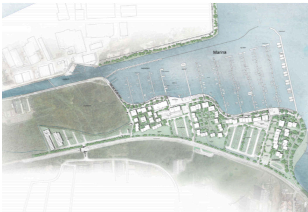
Skitse af projektet

Lystbådehavn Nord nedlægges og flyttes som følge af en strategisk beslutning om at udvikle en stor, top-attraktiv lystbådehavn som led i udviklingen af byens rekreative muligheder og kommunens/regionens turistmæssige udvikling. Dette kan ikke ske ved Lystbådehavn Nord, som er utidssvarende, mangler arealer og er miljømæssigt og arealmæssigt under pres af naboskabet til erhvervshavnen, jernbanen og større vejanlæg. Placeringen ved Marina City sikrer også, at lystbådehavnen kan få et samspil med omgivelserne og blive en integreret del af byen over tid. Dette er ikke muligt ved den nordlige lystbådehavn, bl.a. grundet eksisterende infrastruktur og jernbane. Derfor skal de ca. 500 både her flyttes til ny lystbådehavn. Byrådet besluttede derfor at Marina Syd udvides tilsvarende, og at dette samtidigt sker i kombination med en egentlig byudvikling på stedet.