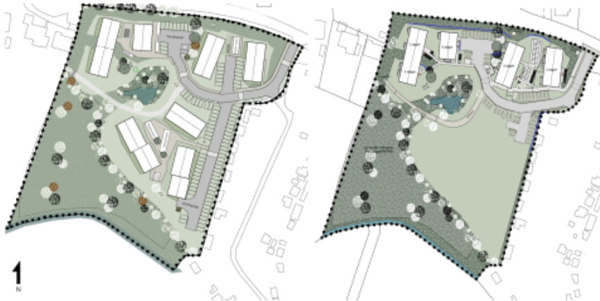
Tidligere projekt og revideret projekt for lokalplan 0212-13

Området blev lokalplanlagt med lokalplan 0212-12, Ved Stadionvej, som er blevet underkendt af Planklagenævnet, da kommuneplanens metode at udregne bebyggelsesprocent på ikke er planlægningsmæssigt begrundet.