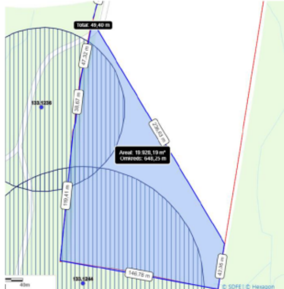
Kortbilag 2 - Oversigtskort over arealet, hvor der pålægges restriktioner.