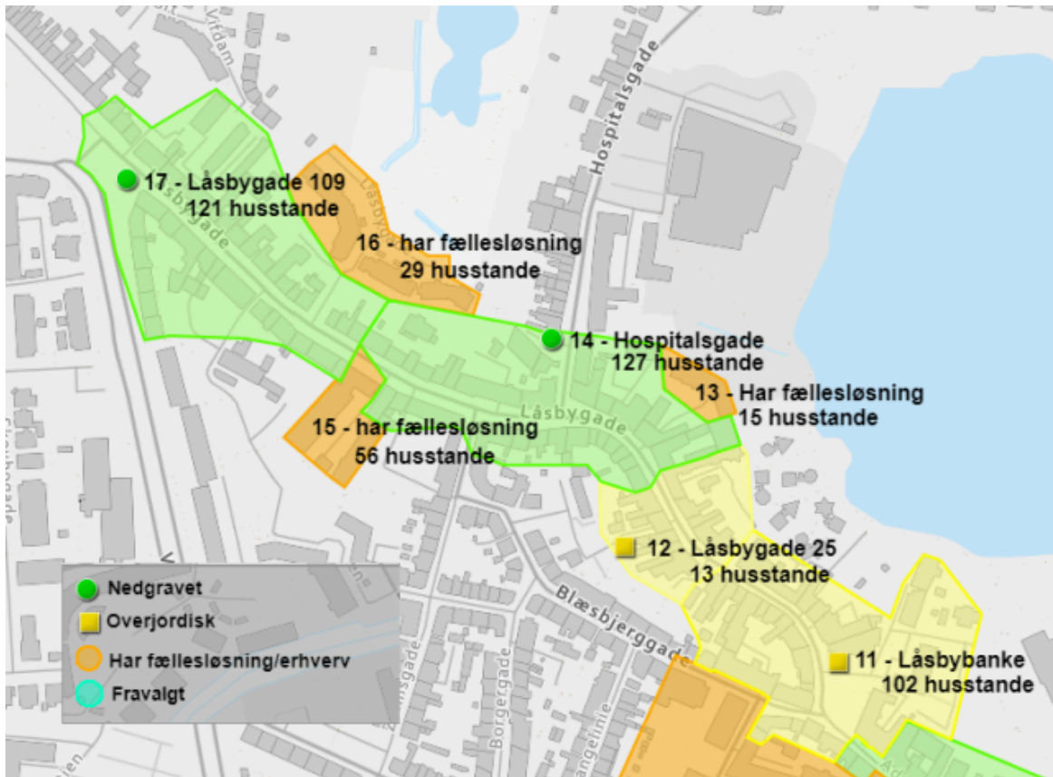
Kort 2: Bydesign-guide område med forslag til placering affaldsløsninger