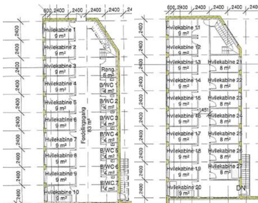
De fremviste skitser over omfanget marts 2017.

I starten af marts 2017 modtager forvaltningen nyt tegningsmateriale i sagen. Plantegninger over sengeafsnittet viser nu 27 hvilekabiner med 81 sengepladser, samlet i et 2 plans byggeri.