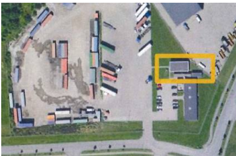
Oversigt over de opstillede hvilebaracker.

Efter besigtigelse og endt partshøring til ejer, bliver den pågældende transportvirksomhed (Contrans A/S) gjort opmærksom på forholdet, som umiddelbart vurderes i strid med områdets lokalplan, der ikke åbner op for mulighed til beboelse.