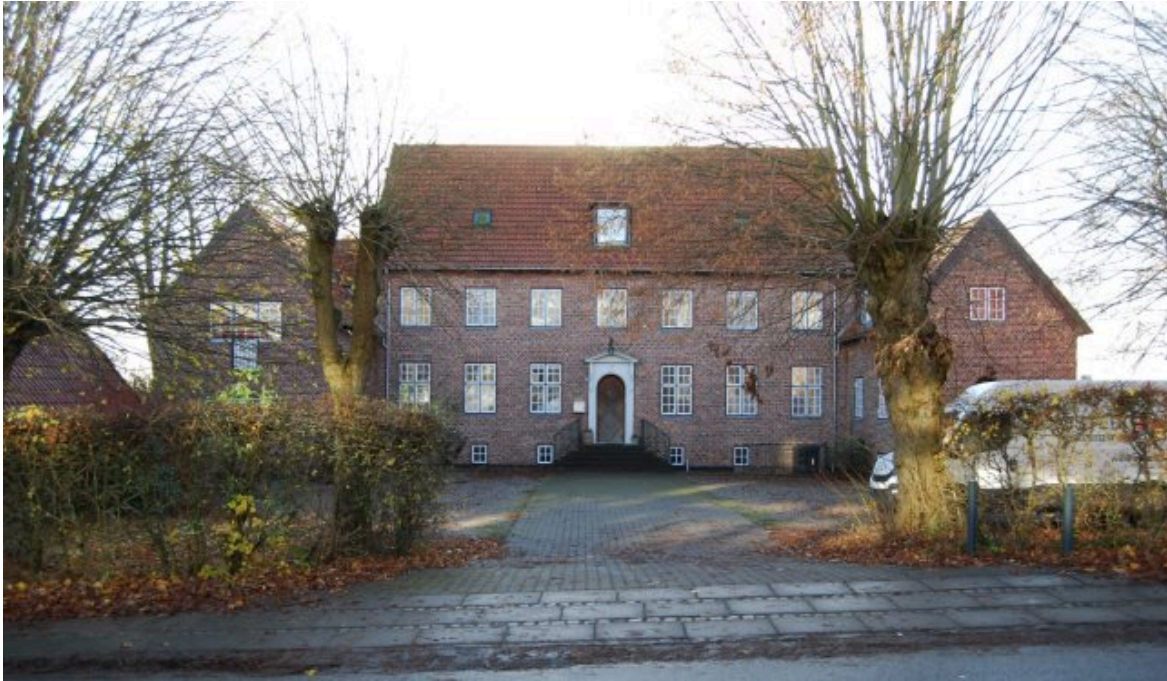
Fuglehøj set fra Dyrehavevej.