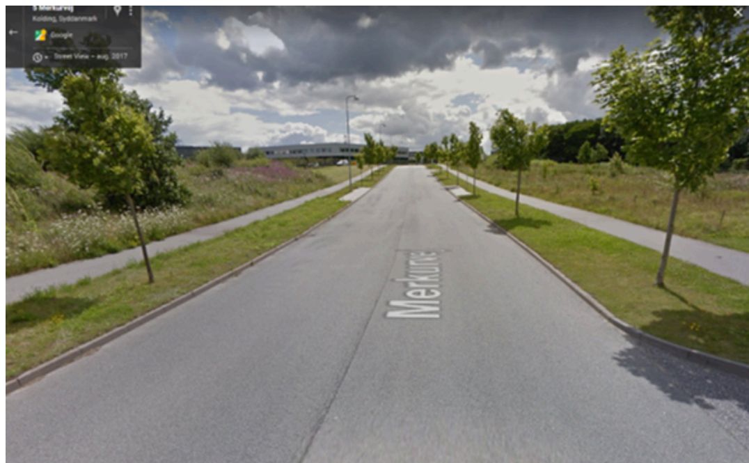
Eksempel på fordelingsvej

Ansøgningens bevillingsmæssige forudsætninger: