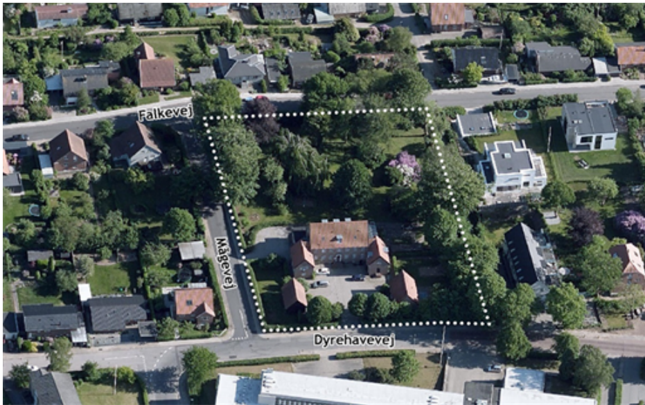
Planområdets afgrænsning svarer til ejendommen Dyrehavevej 101, Kolding. Området set fra nord.