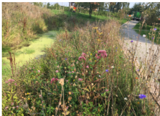
Eksempel på frodig rabat i Christiansfeld.