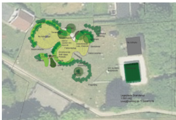
Plan for legemiljø, der ønskes gennemført i 2020.