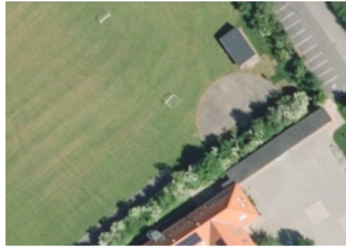
Placering, og nuværende forhold

Projektets idé er centreret om sundhed og sammenhold. Eltang Aktivitetspark skal være et dynamisk mødested, hvor de fysiske rammer er moderne og attraktive. Det skal være et sted for velvære, som indbyder både børn, unge og voksne til fælles aktiviteter i form af leg, sport og hygge både i organiseret og uorganiseret form.