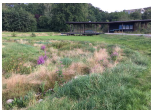
Eksempel på frodigt grøftparti, byparken Kolding.

Landsbyforum indstiller, at der bevilges 5.000 kr. – samt støtte fra forvaltningen – til undersøgelse og forsøg med udvikling af bæredygtigt urtedække i landsbyskala.