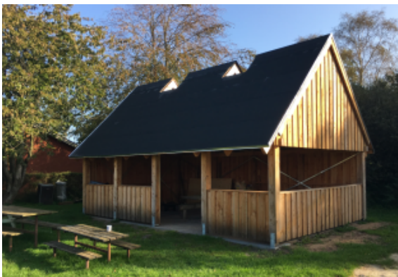
Madpakkehus/udendørs forsamlingshus opført i 2019.

I 2020 indstiller Landsbyforum, at dette projekt realiseres, samtidig med at der er givet støtte til en ny hoppepude, som er områdets store attraktion.