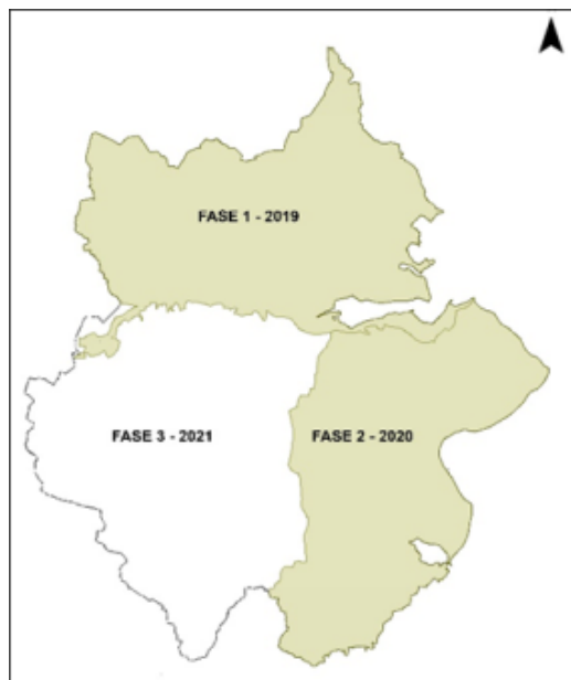
Kort over faserne i den igangværende landskabskortlægning, som gennemføres i perioden 2019-2021

Landskabsudpegningerne i den gældende kommuneplan stammer fra amternes udpegninger og er ikke opdaterede. Kolding Kommune er nu i gang med at gennemføre en analyse af kommunens landskaber efter landskabskaraktermetoden, som er den metode Miljøstyrelsen anbefaler. Analysen udføres i tre etaper, hvoraf to er gennemført.