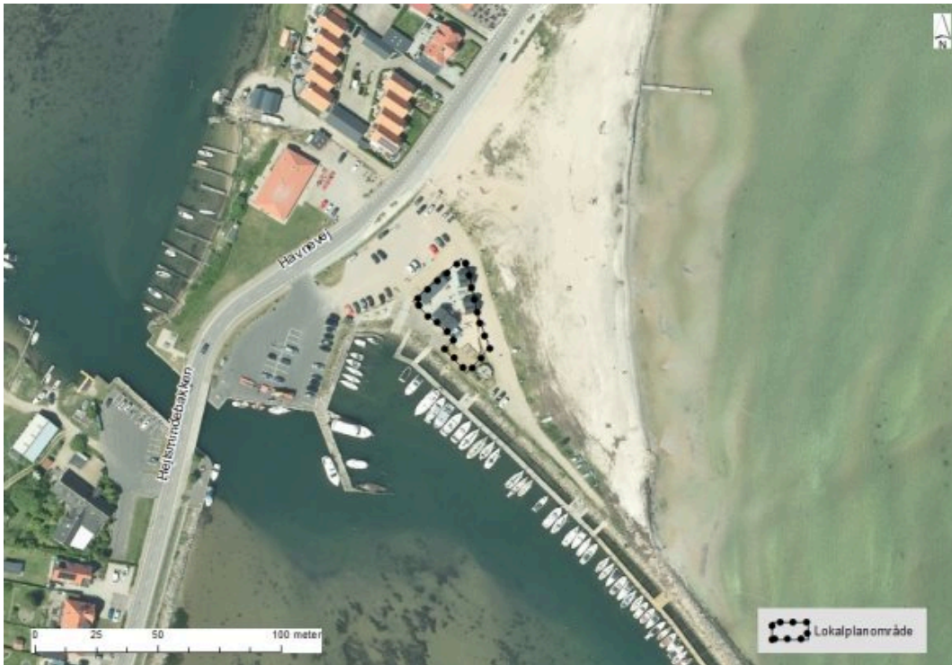
Luffoto med lokalplanområdets afgrænsning

Lokalplanen er udarbejdet på baggrund af, at foreningerne Hejlsminde Bro- og Bådelaug og Hejlsminde Strandpark ønsker permanent at bibeholde den mindre bebyggelse på lystbådehavnen. Med lokalplanen vil dette ønske imødekommes. Dette vil være til gavn for havnens brugere, lystsejlere og besøgende.