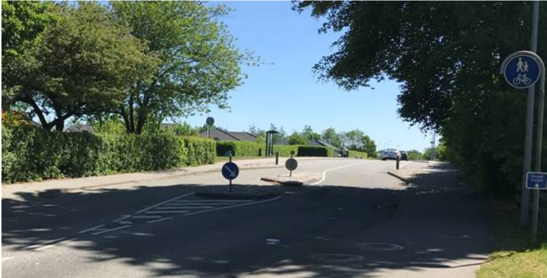
5. Sjølund-Hejls Skole – Sjølund Gade/Åstorpvej - Der etableres hævet flade