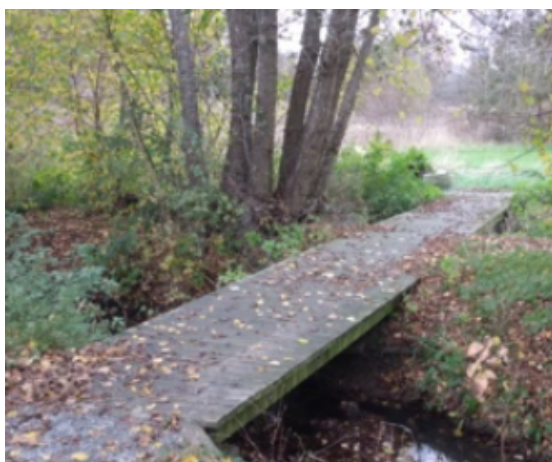
Broen er ikke længere sikker at køre på, derfor skal der i stedet lægges store rør, som vandet i de to bække kan løbe igennem.