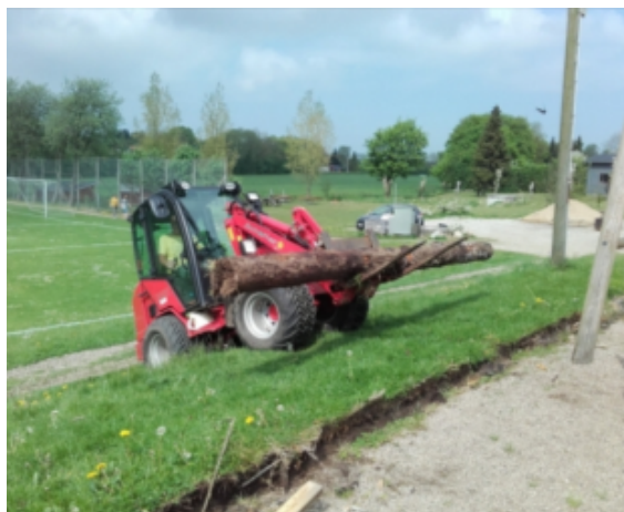
Den lille ged, der bruges til at holde områdets stier vedlige.