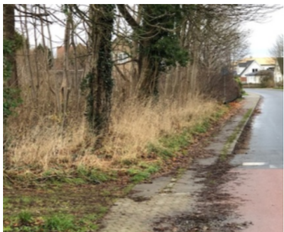
Et stykke af fortovej i Jordrup, som kunne trænge til oprydning.

Forvaltningen bakker op om dette, da Jordrup har langt til den nærmeste genbrugsplads, som ligger i enten Lunderskov eller Kolding.