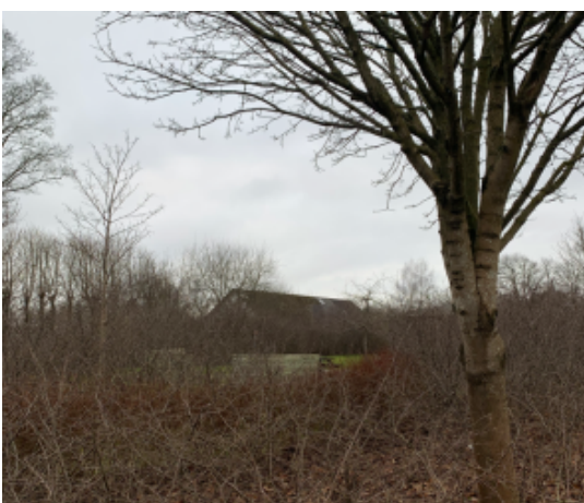
Jordrup Bypark ligger centralt i byen og ville ved en beskæring blive mere synlig i