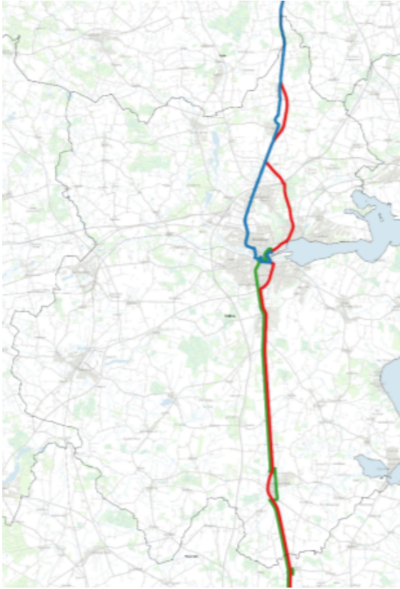
Nuværende ruter Udsnit kun for Kolding kommune