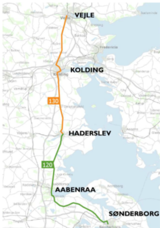
Kort, som viser de nye ruter. (Figur 4 fra Bilag Høring vedr. ændring på Regionale ruter 2027)

For Rute 120 og Rute 130 gælder, at der vil være korrespondance i Haderslev på samtlige ture for de passagerer, som ønsker at rejse hele vejen mellem Vejle og Sønderborg.