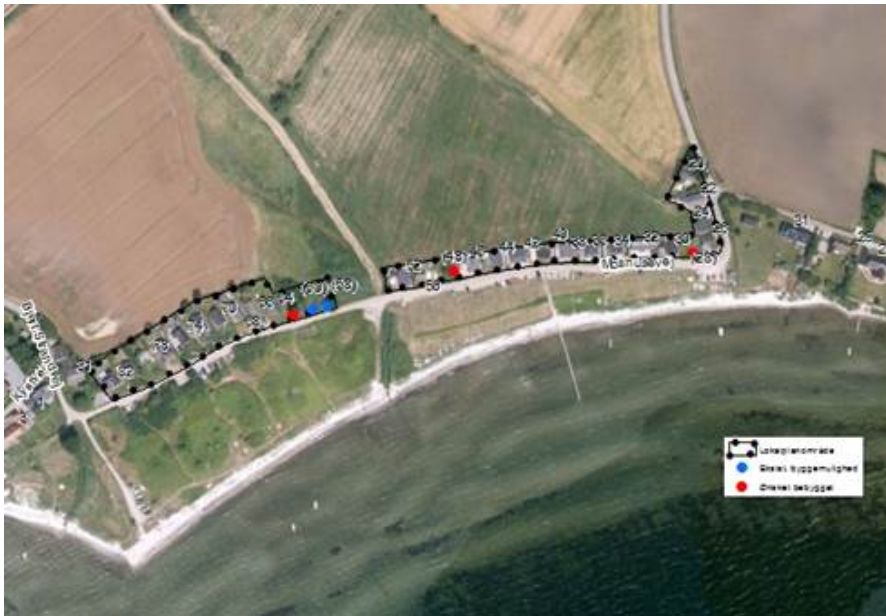
Lokalplanområde ved Moshuse med bebyggelsesønske.