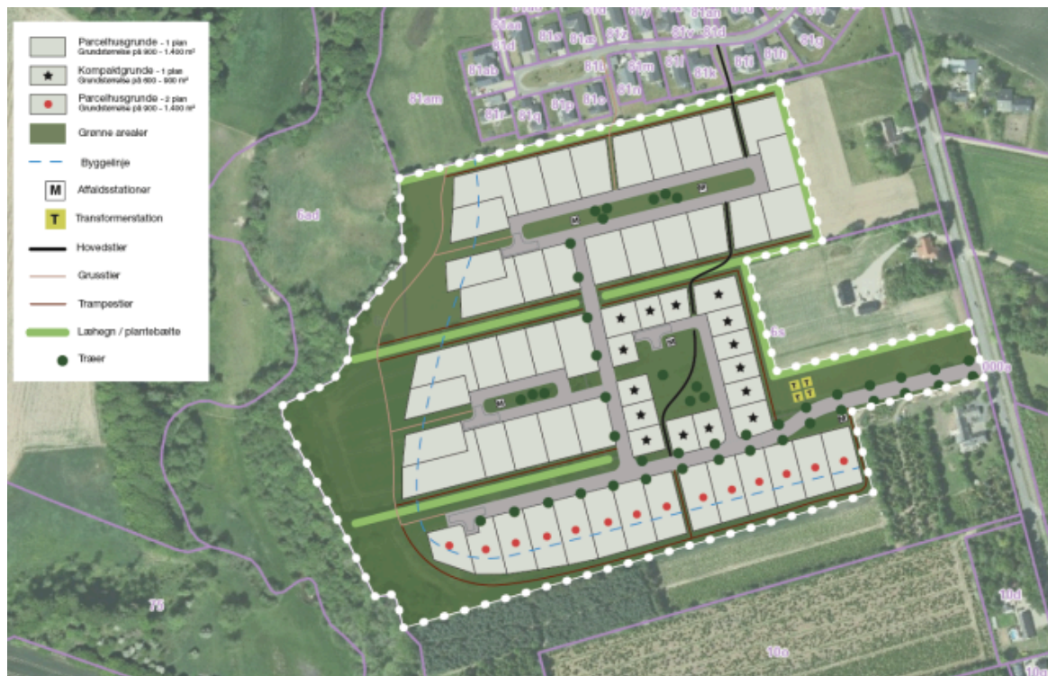
Illustrationsplan, som viser en af mulighederne for, hvordan lokalplanområdet kan komme til at se ud efter planens realisering

På baggrund af lokalplanområdets størrelse forventes det, at lokalplanen vil blive realiseret etapevis.