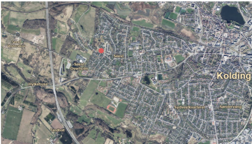
Kort over placering i Kolding Kommune

Boligerne kommer til at ligge på Kløvkærvej 1 og Overbyvej 8C i Kolding - matr.nr. 13 ca og 13 gv, Seest By, Seest.