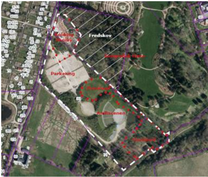
Lokalplanområdet med de fire aktiviteter og nærområdet.

være begrænsede. Som en del af arbejdet med en ny masterplan for Geografisk Have vil man få lejlighed til at overveje, hvordan haven fysisk skal samspille med såvel Kolding Miniby, parkeringsarealet, Floralund, Amfiscenen og landskabet ved Dalby Møllebæk.