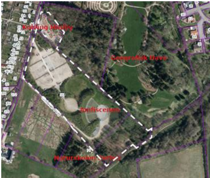
Lokalplanområdet (stiplet) i dag.