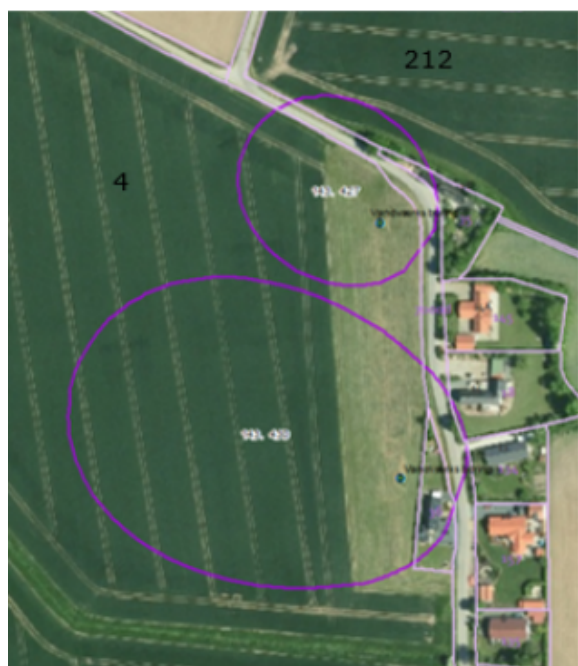
Figur 1. Oversigtskort over arealer, hvor der pålægges restriktioner

Oversigtskort over to af Aller Vandværks vandværksboringer beliggende på matr.nr. 4 og 212, Aller Ejerlav, Aller