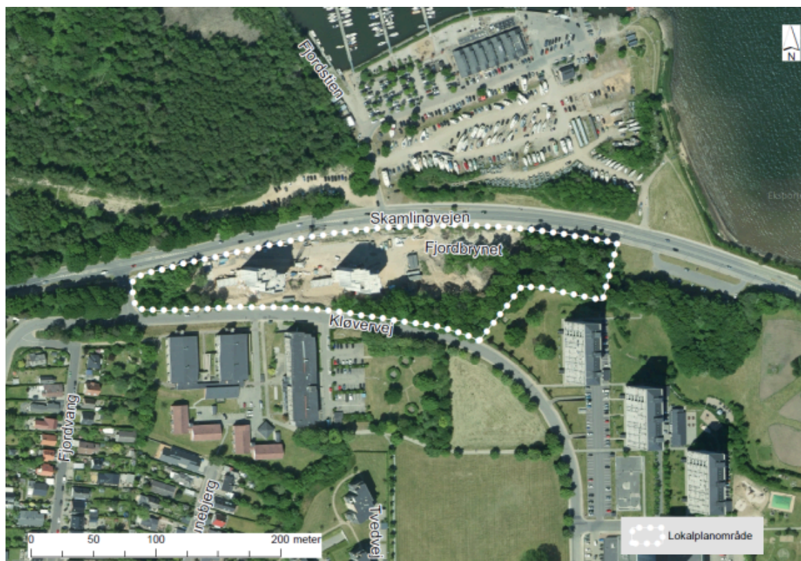
Området for lokalplan 1013-21 vist på baggrund af et luftfoto

Der udarbejdes således plangrundlag for projektet med de fire punkthuse og det er fortsat hensigten, at den nye bebyggelse skal udgøre en samlet visuel helhed sammen med de eksisterende etageboliger ved Kløvervej og Tvedvej.