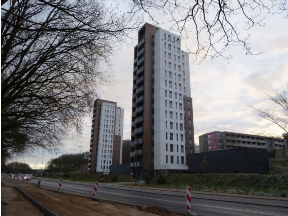
Foto af området med de vestlige 2 tårne opført, december 2021