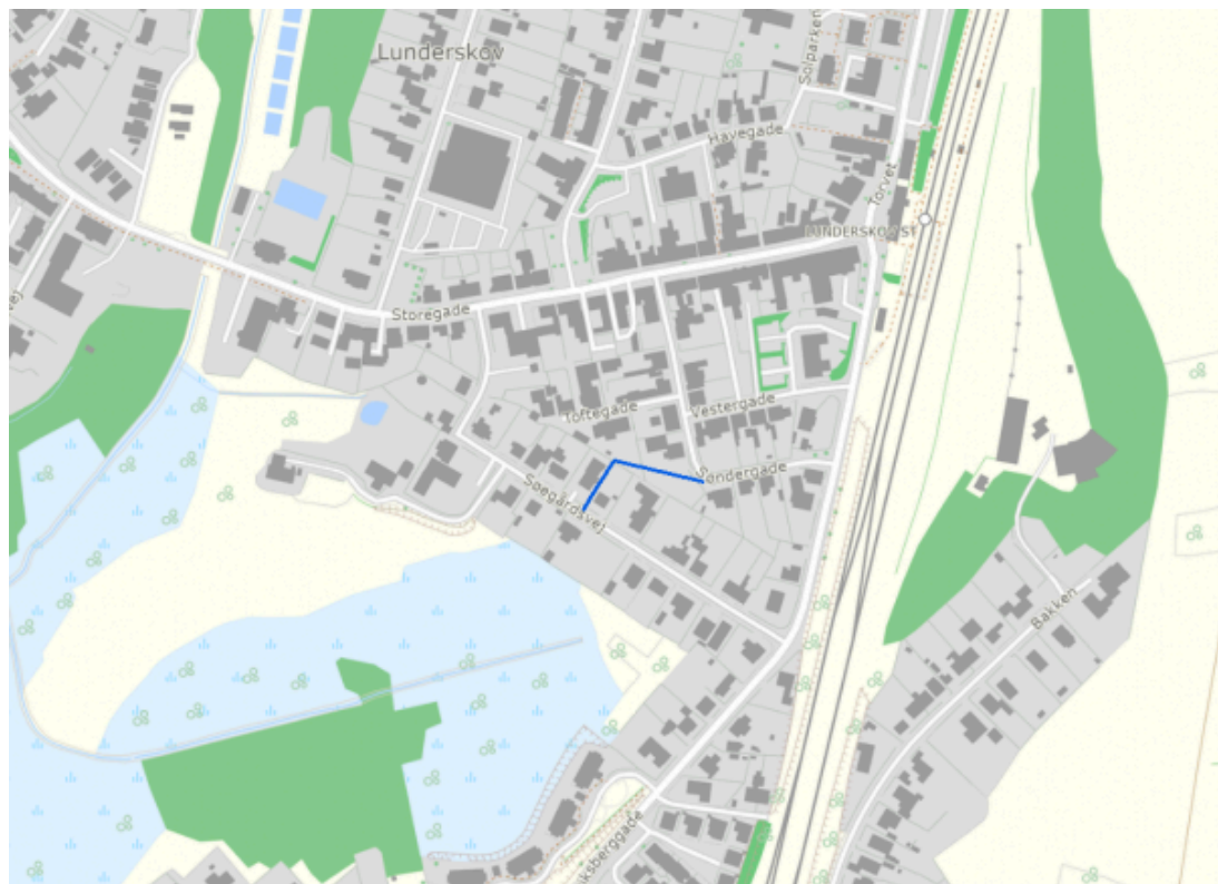
Oversigtskort - blå markering viser linjeføringen

Der har været en dialog med de berørte private grundejere, og der er opnået frivillige aftaler med fire af grundejerne, men den sidste grundejer ønsker ikke en ny ledning på sin matrikel.