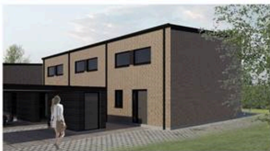
Principfacader set fra indgangssiden

Bebyggelsesforslag: Agtrupvej 219, 6000 Kolding