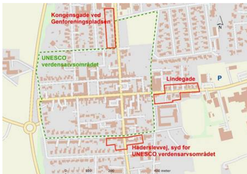
Byfornyelsesinitiativer langs indfaldsveje til verdensarvsområdet

Formålet er at forbedre bygningernes facadeudtryk og skabe en mere æstetisk sammenhæng mellem indfaldsvejene og UNESCO verdensarvsområdet, ved at forbedre ankomsten til midtbyen.