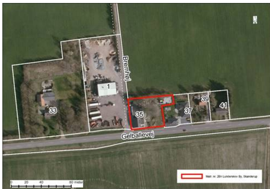
Luftfoto 2017. Gelballevej 35 markeret med rød.