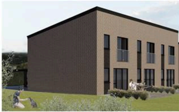
Principfacader set fra havesiden

Boligtype 115 m 2 Lasse Larsen Huse Etableret 1988