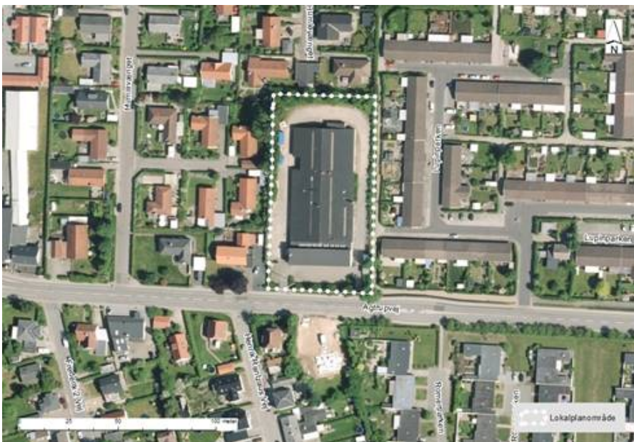
Afgrænsning af lokalplanområdet.

Lokalplanen er kategoriseret som en B-lokalplan jævnfør A, B, C kategoriseringen, hvilket betyder, at det er Plan-, Bolig- og Miljøudvalget, der har kompetence til at træffe beslutning om, at planforslaget sendes i offentlig høring.