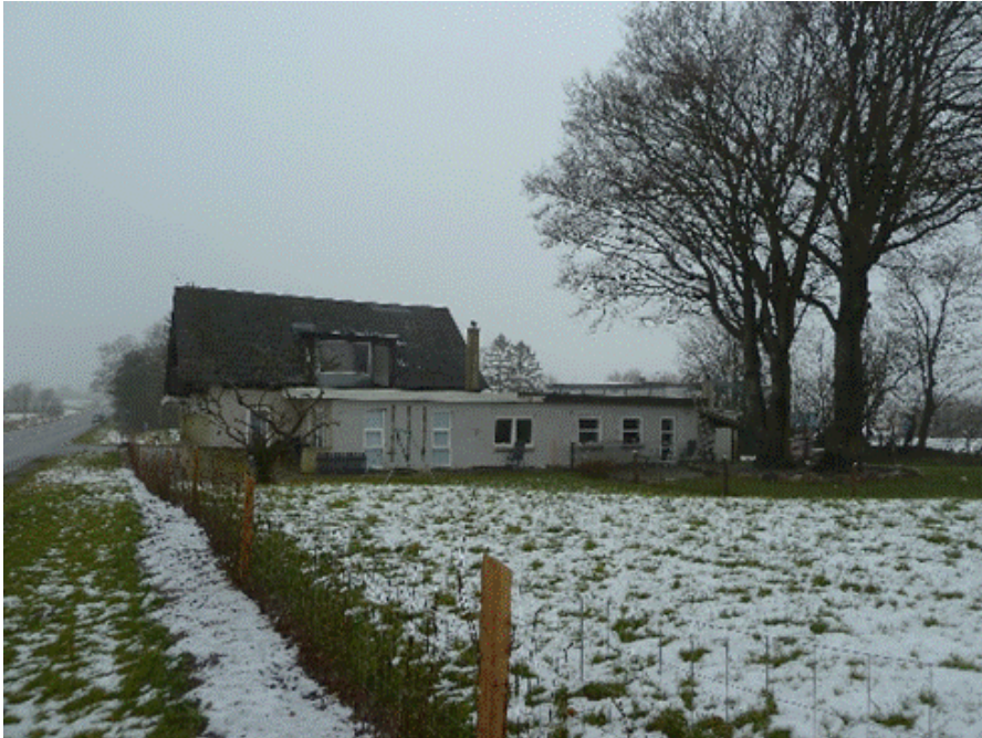
Gelballevej 35. 23. januar 2018. Flere fotos i bilag.

Boligarealet, der ønskes indrettet til bolig nummer to, er primært en tidligere gildesal og et værelse og udgør ca. 70 m 2 . Denne del af bebyggelsen er beliggende sammen med garagen i en etage med built-up tag.