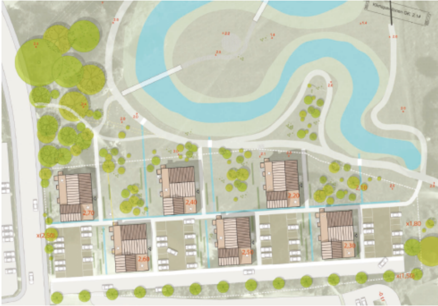
Illustrationskitse for bebyggelsen i forslag til lokalplan 0021-15

Lokalplanområdet disponeres med bebyggelse og grønne områder ud mod Byparken, så bebyggelsen så vidt muligt har direkte forbindelse til parken, og så bebyggelsens grønne områder opleves som en forlængelse af parkområdet. Adgangsvej og parkeringsarealer placeres i den sydlige del af området.