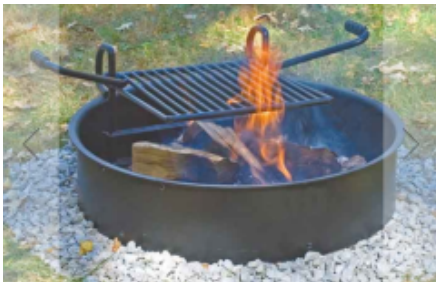
Det ønskes at denne type af bålsted etableres.

Vamdrup Byforum ønsker samtidigt at der også opsættes en bålring ved Bønstrup Sø i forbindelse med fugletårnet og bord-/bænkesættet.