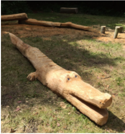
Legepladsen i Frederikkelund, billede fra 2016.