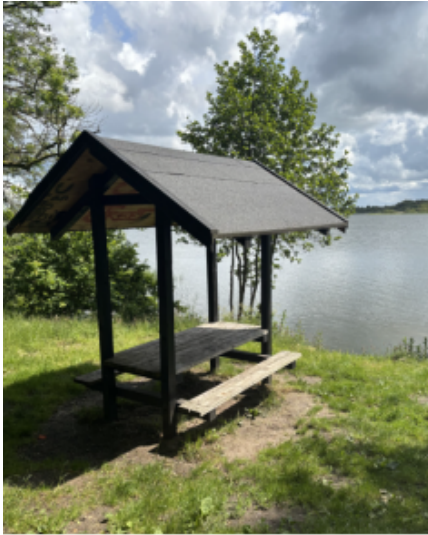
Eksempel på bordebænkesæt med tag.