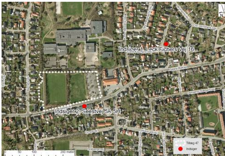
Fig. Kort over indsigere placering i forhold til tillæg 47 område.

Der er ved indsigelsesfristen for den offentlige høring modtaget 2 indsigelser.