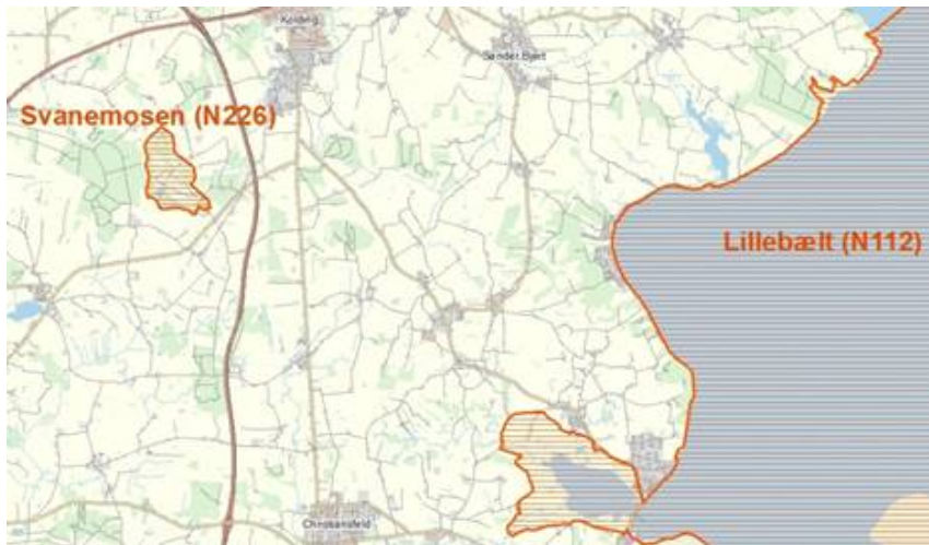
Kort 1. Viser den geografiske afgrænsning af Natura 2000-områderne Svanemosen og Lillebælt (den del, som ligger inden for kommunegrænsen).