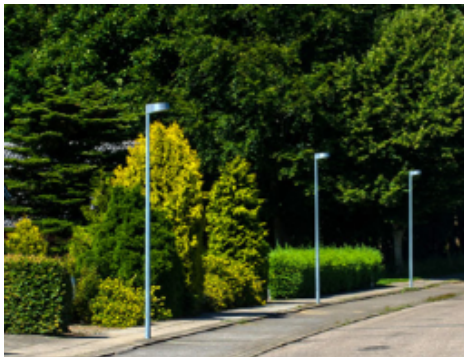
Eksempel på lamper, der ønskes opsat.

Forvaltningen oplyser, at alleen er ejet af Brødremenigheden, men er offentlig tilgængelig ligesom stien er offentlig tilgængelig.