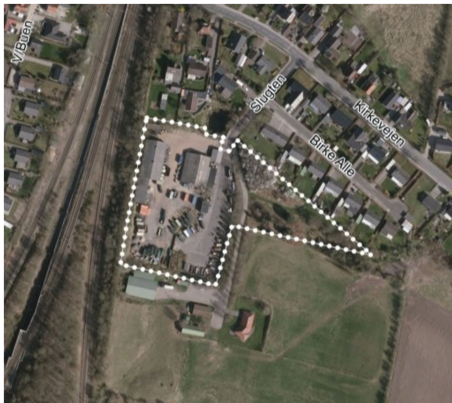
Luftfoto med lokalplanområdets afgrænsning.

Der er tale om en juridisk lovliggørelse af funktionen som genbrugsplads. (Tidl.) Lunderskov Kommunes oplagsplads er lovligt etableret i ca. 1968 (før planloven). Efterfølgende udvidelse af pladsen, funktionsændringen til genbrugsplads, samt opførelsen af nogle af de tilhørende byggerier er sket uden plangrundlag. Området med opstillede containere er vurderet ud fra luftfotos, etableret som del af oplagspladsen mellem 1985 og 1990. Funktionen som genbrugsplads er vokset trinvist i omfang og er ad flere år blevet den primære anvendelse af området.