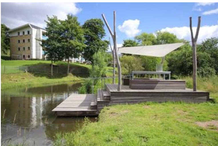
”Akvariet” ved Kolding Å.

Åstedet vil blive målrettet til undervisningsbrug og opholdsmuligheder.