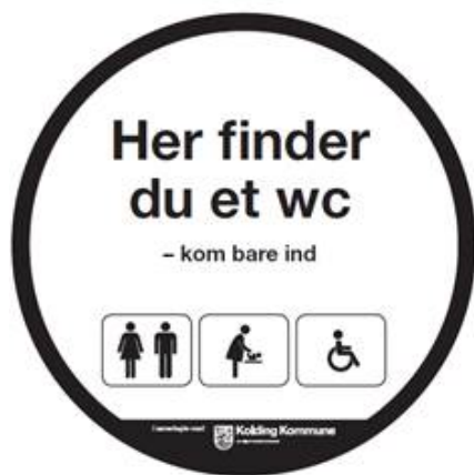
Figur 2: Piktogram med mulighed for tilvalg af puslebord og handicapsymboler

City Kolding har fremsat ønske om en kompensation eller tilskud til den øgede renholdelse til de erhvervsdrivende, der stiller toiletter til rådighed.