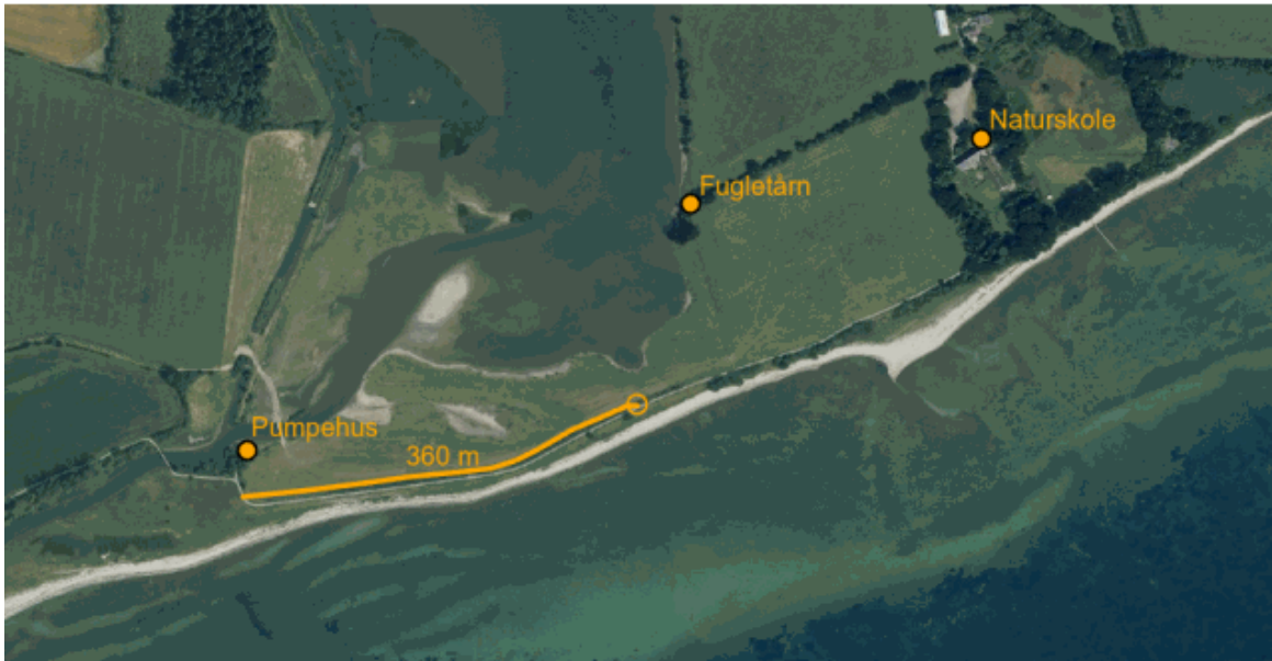
Stistrækning, der skal genetableres.