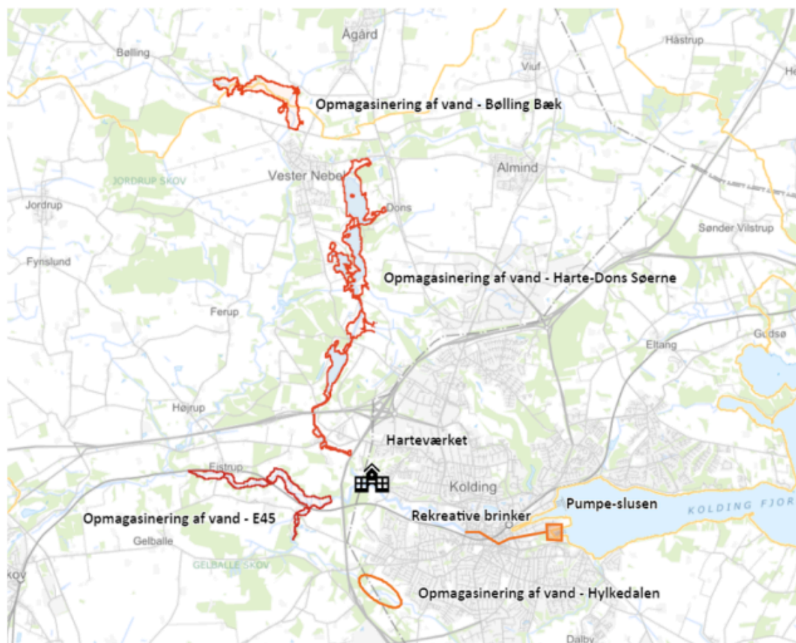
Figur 1. Kort over opmagasineringsmuligheder i Oplandsprojektet.

Der opmagasineres vand i bassiner i oplandet ved hhv. ådalen vest for motorvej E45, i Harte-Dons Søerne ned til Harteværket samt i ådalen ved Bølling Bæk.