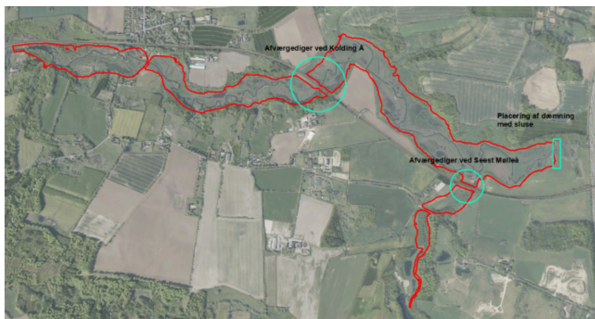
Figur 2. Rød polygon viser den ydre projektgrænse. Markeringerne med turkis viser placeringerne af de fysiske anlæg.

Nedenstående kort viser projektområdet i ådalen vest for motorvej E45. På kortet ses placeringen af dæmningen med sluse i ådalen samt afværgedigerne mod jernbanen. De øvrige arealer inden for projektgrænsen udgøres af midlertidigt oversvømmede arealer.