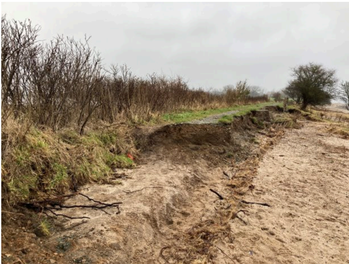
Foto af stien, der er delvis eroderet væk.