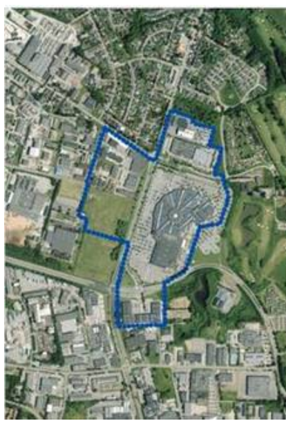
Afgrænsning - model 2