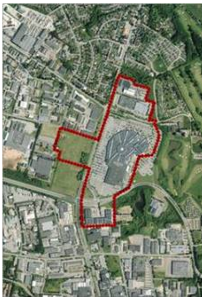
Afgrænsning - model 1

Nedenfor angives 2 mulige afgrænsninger - i model 2 er eksisterende detailhandelsarealer ved Albuen medtaget. Området er omfattet af en byplanvedtægt fra 1976 og er udlagt til erhvervsformål, men er over tid udviklet med flere butikker.