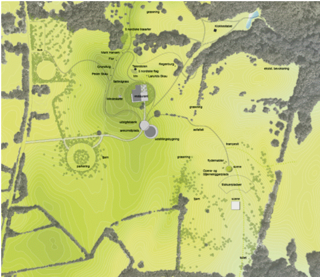
Højskamlingområdet, spot nr. 1 med besøgscenter, parkeringspladser, restaurant og nyt operaområde

Hovedgrebet på Højskamling er at få skabt et sammenhængende, roligt landskab, hvor Mindestøtten og de øvrige monumenter får en mere central fremtræden. Derfor er den eksisterende parkeringsplads flyttet, og den gamle udstillingsbygning er fjernet.