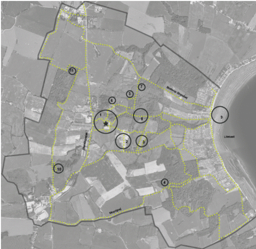
Særlige landskaber udpeget til placering af spots

Der er et meget stort ønske fra de involverede interessenter om, at landskabet bliver åbnet for adgang og for anlæg af flere aktiviteter. I Udviklingsplanen er det derfor tillagt stor værdi, at besøgende inviteres længere ud i landskabet for at opleve den store mangfoldighed i natur og landskab. I tilknytning til det forbedrede stinet etableres derfor følgende nye attraktioner, spots, i området: