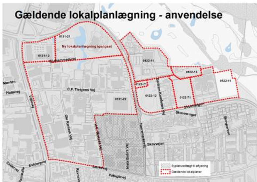
Gældende planlægning i området