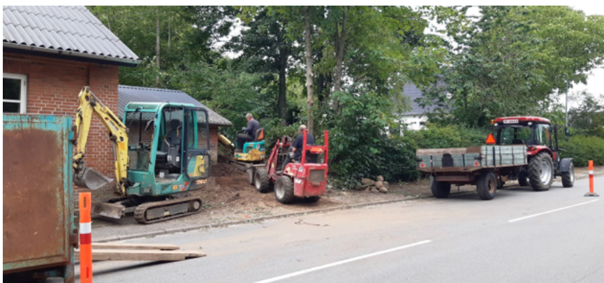
Lokale borgere i Dons graver og kører jord væk fra forsamlingshusets gavl.

Dons var en af de landsbyer, der fik gavn af 22.500 kr. fra junipuljen. Her fik man gravet jord væk fra facaden og sikret, at fugt ikke kan skade huset fremadrettet. Efterfølgende skal der lægges grus og sten, så facaden kan ånde og tilsyn med huset lettes.