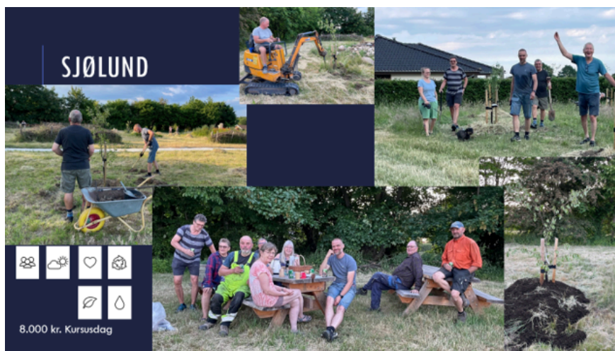
Fotos fra kursusdagen i Sjølund.