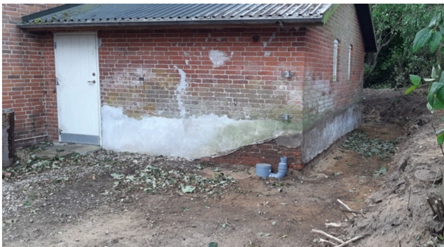
Forsamlingshusets gavl efter bortgravning af jorden.

Harte forsamlingshus fik 113.464 kr. til renovering af p-pladsen samt fliserne hen til forsamlingshuset indgang. Alt arbejde er udført af professionelle håndværkere.