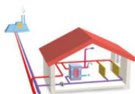
Skitse af fjernvarmesystem.