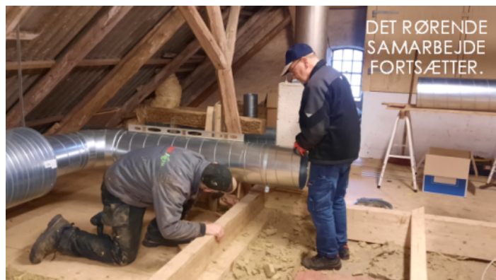
Landbomuseets frivillige arbejder på deres varmegenindvinding og ventilation. Her er de på loftet og arbejder med rørsystemet.

Dons var en af de landsbyer, der fik gavn af 22.500 kr. fra junipuljen. Her fik man gravet jord væk fra facaden og sikret, at fugt ikke kan skade huset fremadrettet. Efterfølgende skal der lægges grus og sten, så facaden kan ånde og tilsyn med huset lettes.