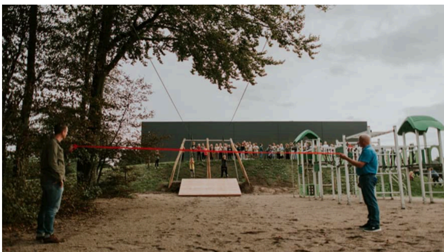
Svævebanen bliver taget i brug og den røde snor klippes.

Landbomuseet er også kommet i mål med en større ombygning, så nu er deres lokale godkendt til retmæssig brug og til udlejning. Landbomuseet fik et tilskud på 292.204 kr. og har selv bidraget med meget stor frivillig arbejdskraft.