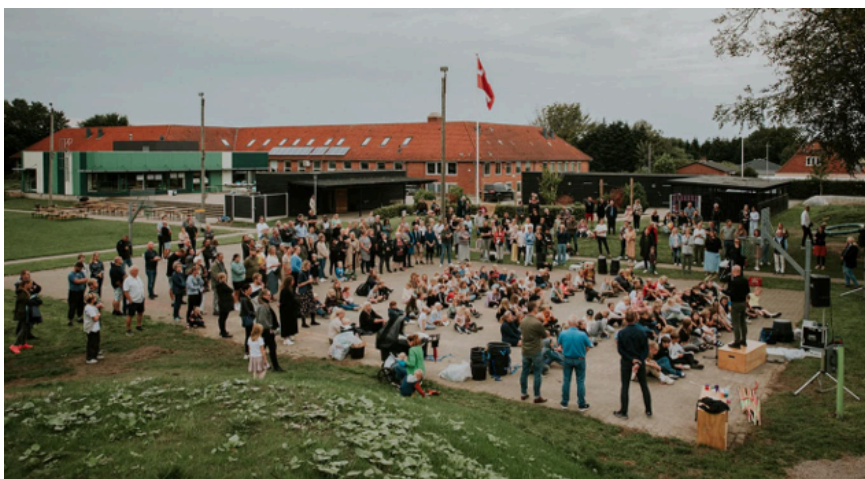
Udsigt over pladsen med de mange mennesker til indvielsen.

Et par af årets større anlægsprojekter i landsbypuljen 2023 er anlæggelse af legepladsen i Sjølund, som efter mange års ihærdigt arbejde med at søge fonde er kommet i mål. Der blev holdt en indvielse den 21. september 2023. Landsbypuljen havde støttet projektet med 200.000 kr. til medfinansiering til fundraising.