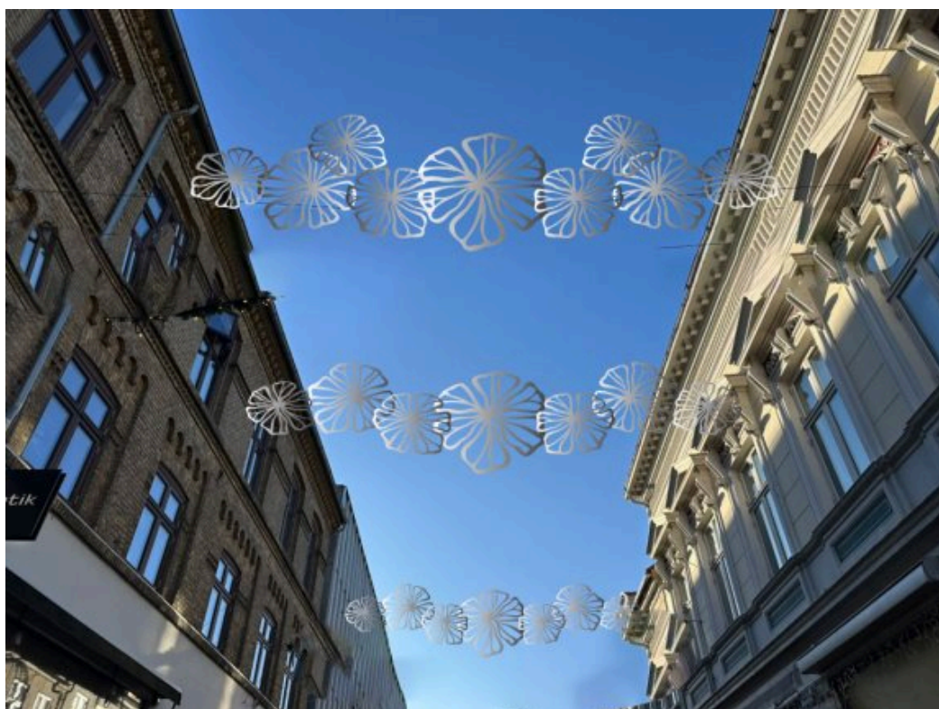
Skitse på 2D-version af blomsten. Skal hænge i de brede gader.