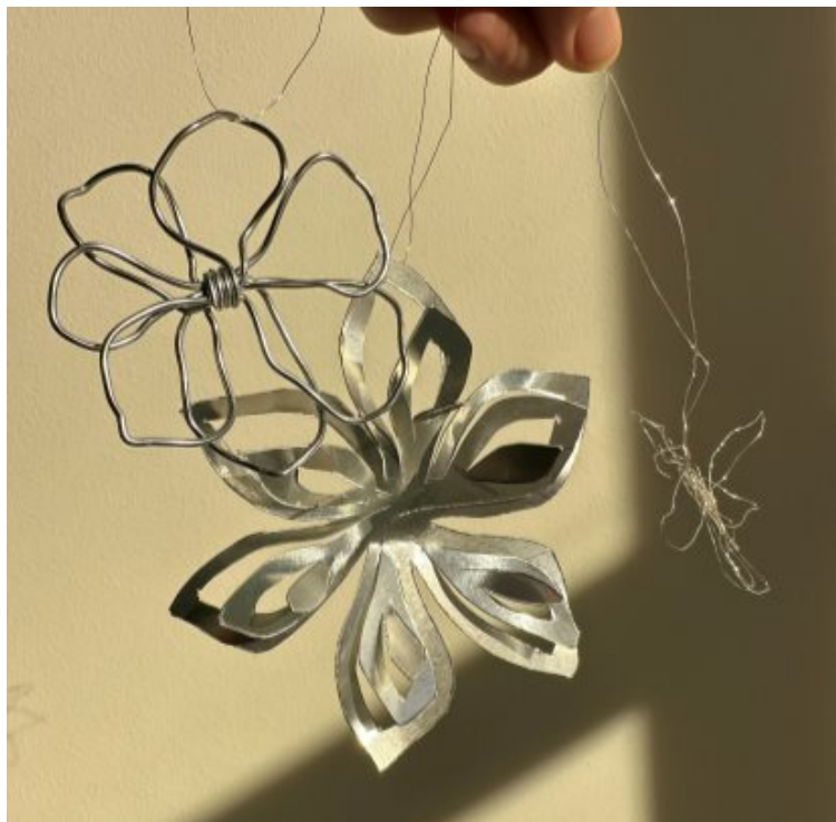
Billede af de forskellige versioner af sølvblomsten, der blev arbejdet med på bylivsmødet.

På det åbne bylivsmøde om bymidten i september 2025, blev der afholdt en workshop, hvor alle interesserede kunne bidrage med tanker om udsmykning og lave deres egne prototyper. Der var positive tilkendegivelser om udsmykningskonceptet og de mock-ups, som blev præsenteret. Særligt motivet med sølvblomsten valgte stor begejstring.